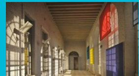
Grande galerie, hôtel Saint-Jean

Découverte, par groupe, d'une partie des intérieurs de l'hôtel.