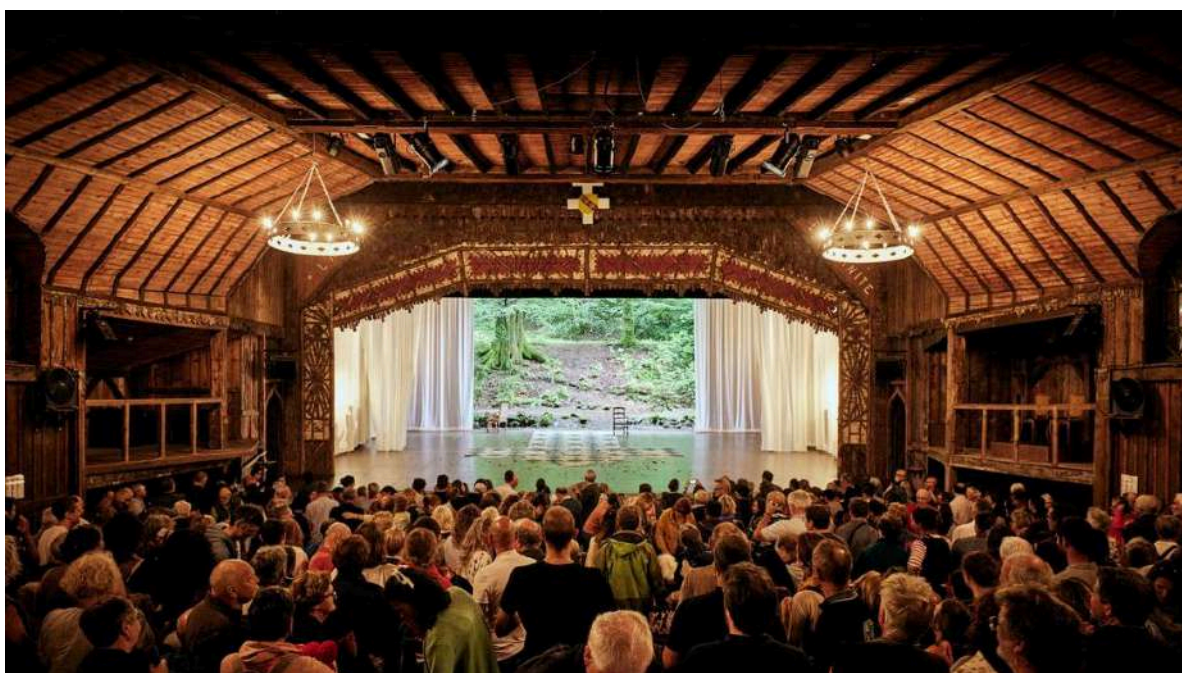
Le théâtre du Peuple, à Bussang, dont le fond de scène s'ouvre sur la forêt vosgienne