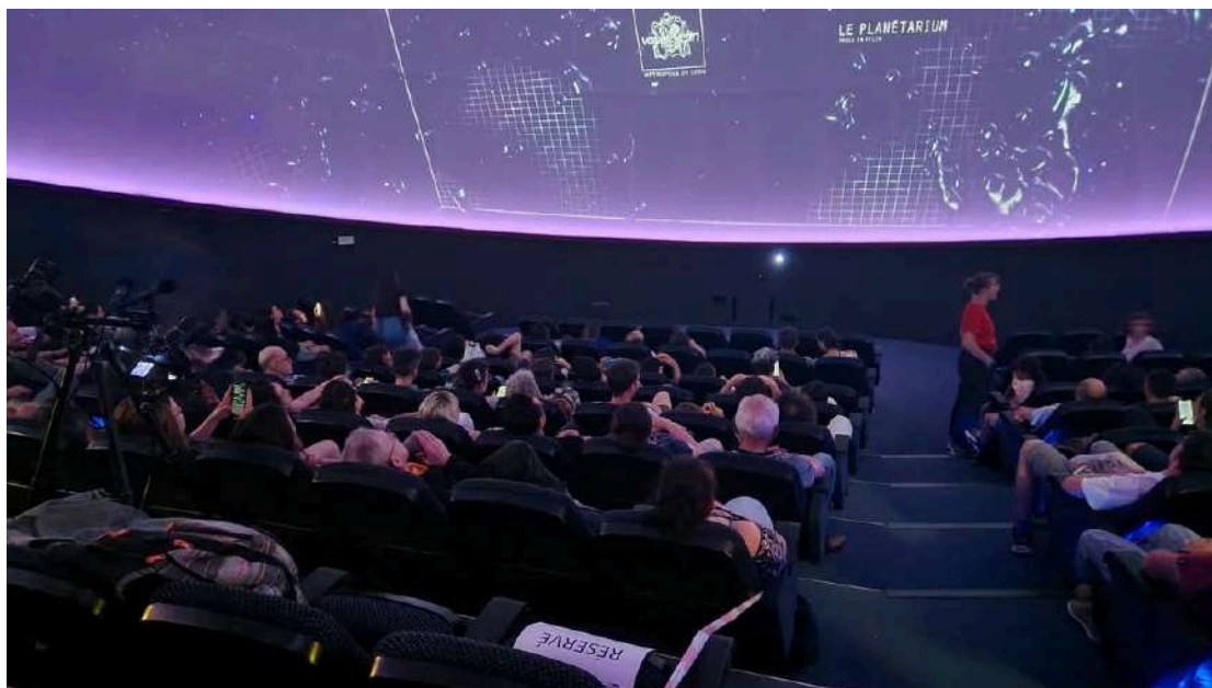
La salle du planétarium de Vaulx-en-Velin

La couverture territoriale des initiatives en matière de culture scientifique présente toutefois des disparités, des associations ancrées sur les territoires telles que Ebulliscience, au cœur d'un quartier populaire de Vaulx-en-Velin, proposent des ateliers scientifiques gratuits en direction des enfants, des familles et des jeunes. L'association va au-delà des ateliers en formant au métier de la médiation scientifique des mères de famille issues des QPV et en organisant des sorties autour de la culture scientifique pour créer du lien, l'apprentissage des sciences, faire découvrir le planétarium et donner des idées d'orientation scolaire aux plus jeunes. Si les grandes métropoles disposent généralement d'infrastructures importantes et d'une offre riche et diversifiée, certains territoires ruraux, ultramarins ou en reconversion industrielle rencontrent des difficultés pour garantir un accès équitable à ces ressources. Ces inégalités géographiques justifient la nécessité d'un soutien renforcé de l'État en lien avec les collectivités locales et les acteurs de terrain, notamment pour favoriser les projets itinérants, les plateformes numériques et les partenariats innovants.