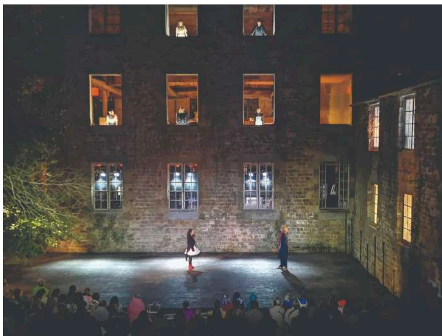
© Compagnie le K, Simon Falguières

Cette réforme accentue donc la logique de déconcentration, en cherchant à rapprocher l’État du terrain et à assurer la visibilité de son action au niveau local. Mais elle place, par contraste, la décentralisation et le rôle des collectivités territoriales dans un entre-deux : si l’État affirme sa volonté d’adapter ses politiques aux spécificités des territoires, les collectivités continuent de revendiquer une légitimité identitaire et une capacité de pilotage des politiques publiques culturelles, que cette relance de la déconcentration tend à encadrer et parfois à concurrencer.