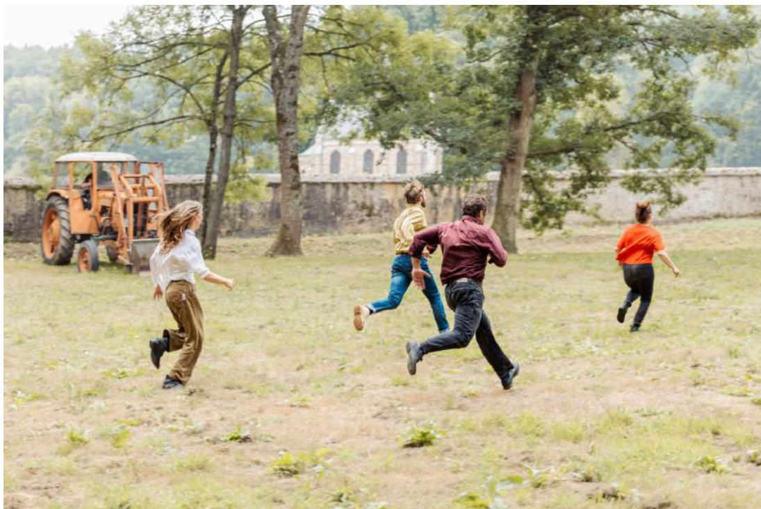
Que ma joie demeure , mise en scène de Clara Hédouin