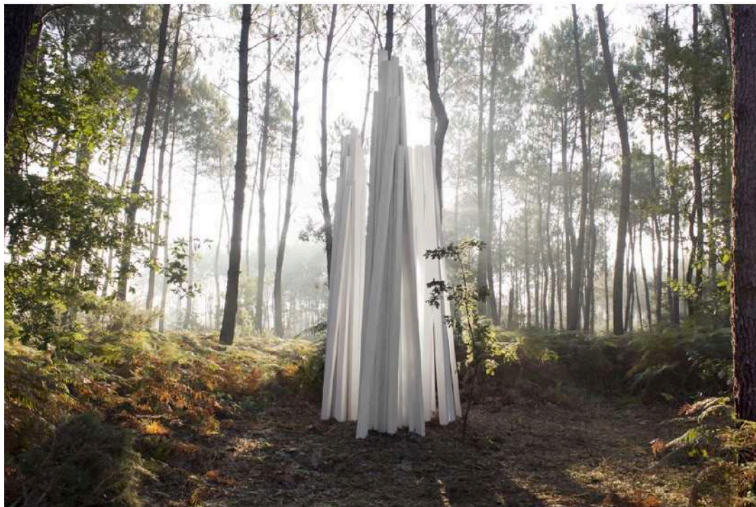
© La forêt d'art contemporain, Trois sans nom, oeuvre n°14

œuvres ont été installées dans le cadre de ce programme qui figure aujourd'hui parmi les 10 mesures-phares de la charte du parc.