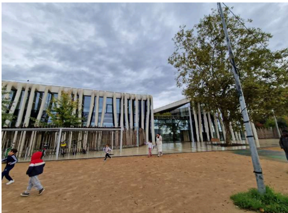
L'Atelier de Léonard, médiathèque - maison de quartier à Vaulx-en-Velin