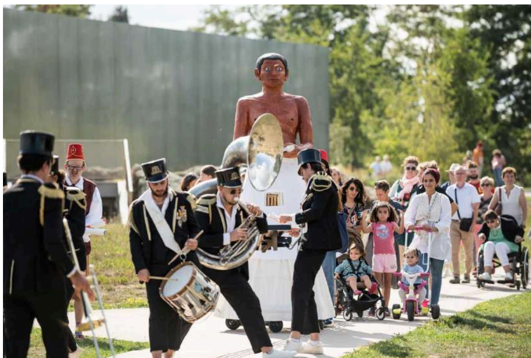
Parade organisée par le Louvre Lens à l'occasion de ses 10 ans, mobilisant des fanfares locales