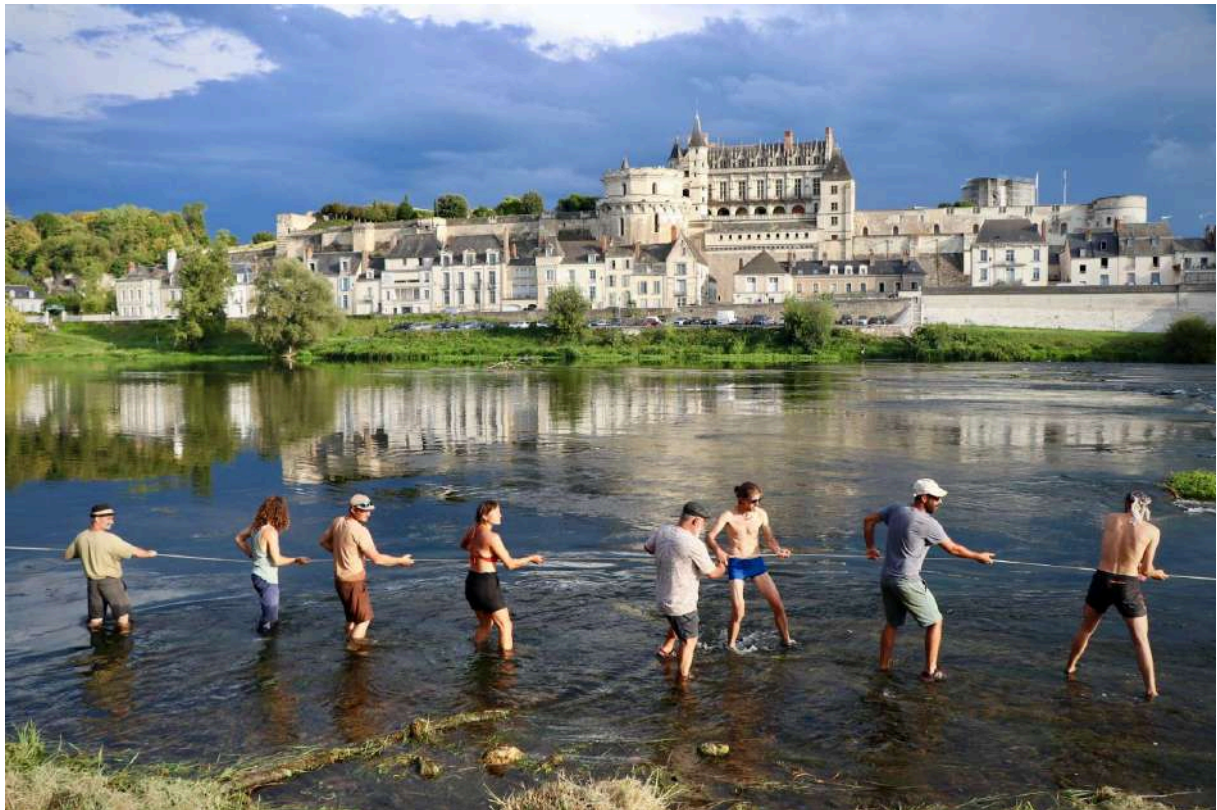
Le Parlement de Loire @ POLAU

Relevons également que de tous les exemples examinés dans le cadre de cette étude, l'exemple le plus convaincant d'identité culturelle de territoire forte et vivante s'est manifesté dans le Parc naturel régional (PNR) des Landes de Gascogne, labellisé 100% EAC.