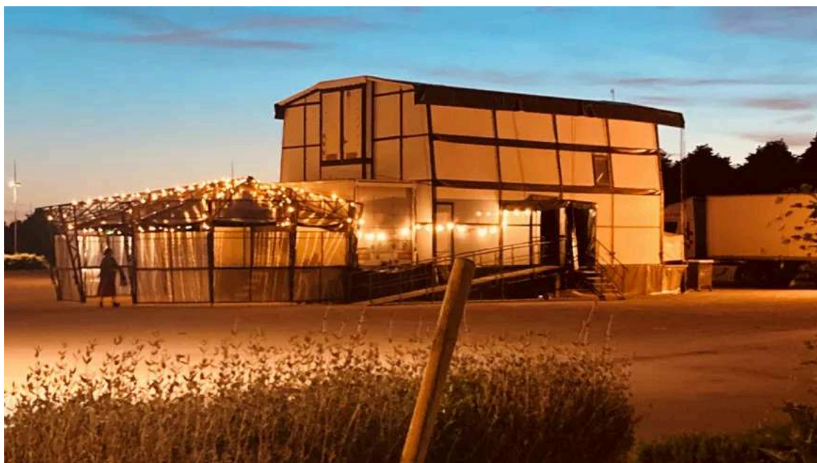
Opéra mobile de Lyon