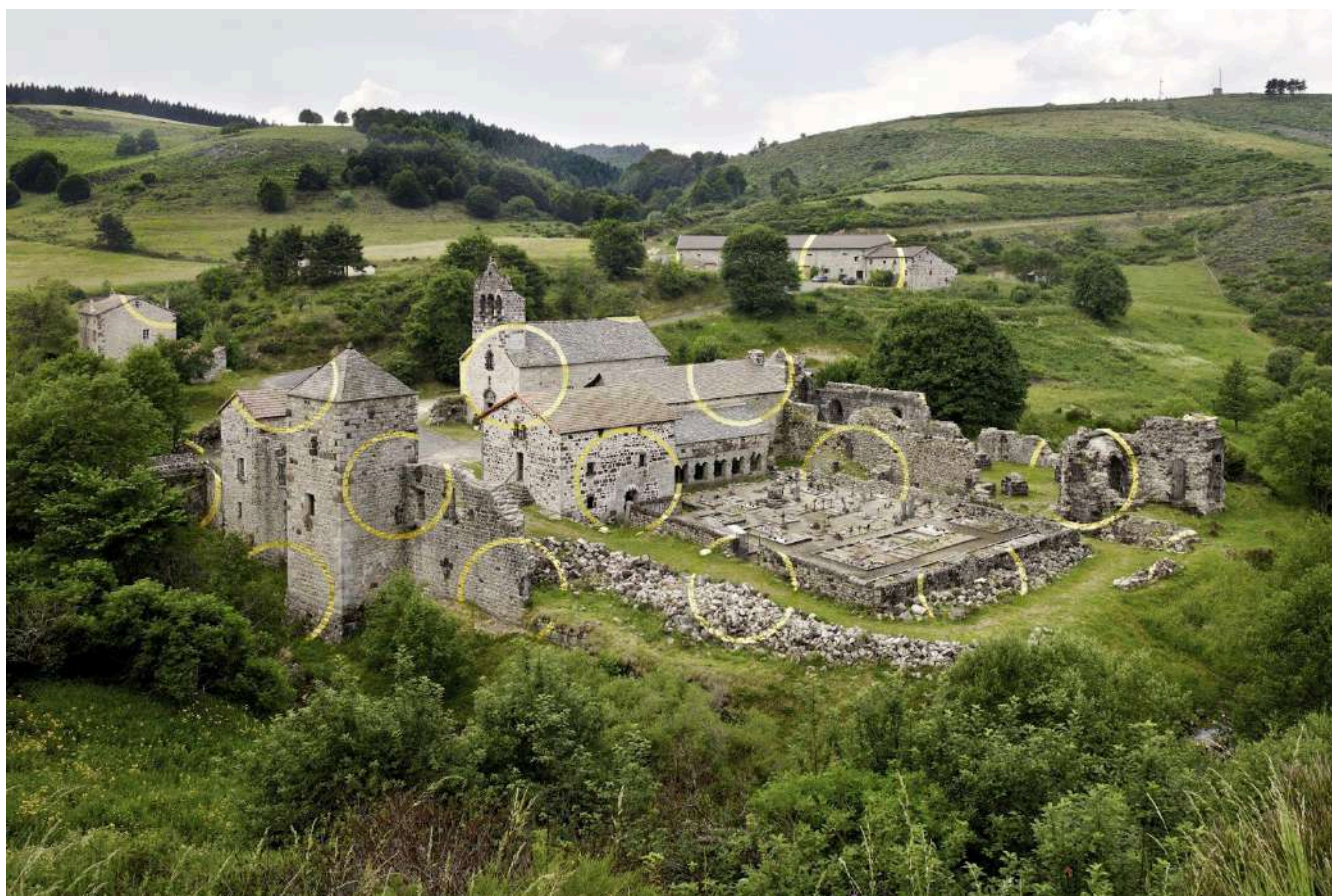
Un cercle et mille fragments de Felice Varini, ruines de l'abbaye de Mazan (Ardèche)

Identités de territoire : quelles coopérations entre l'État et les collectivités territoriales pour une politique culturelle à la fois située et ouverte ?