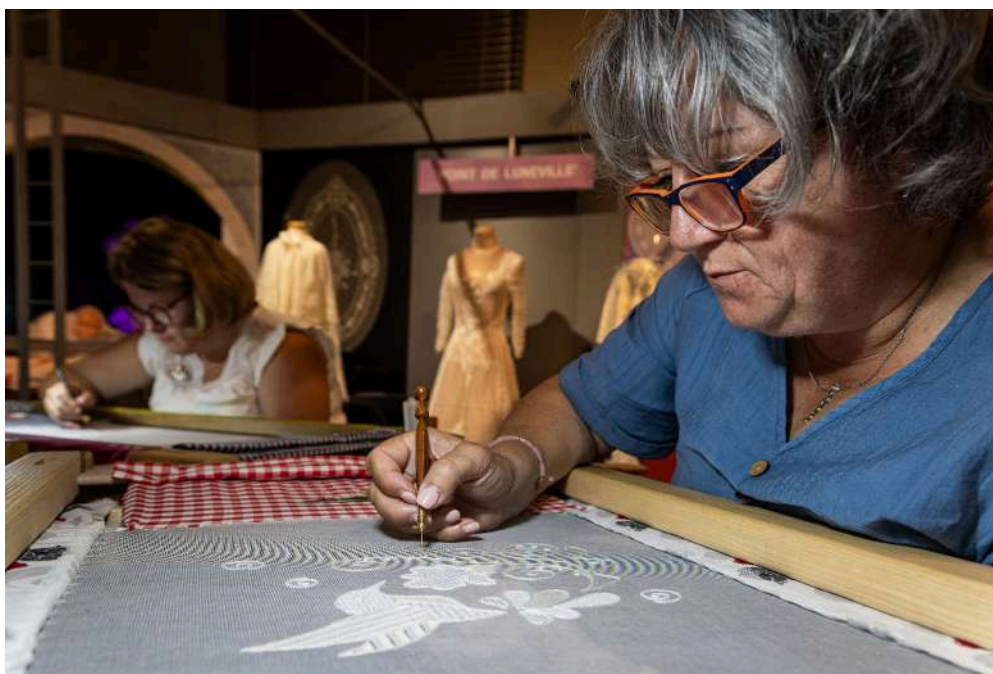
Conservatoire des broderies de Lunéville