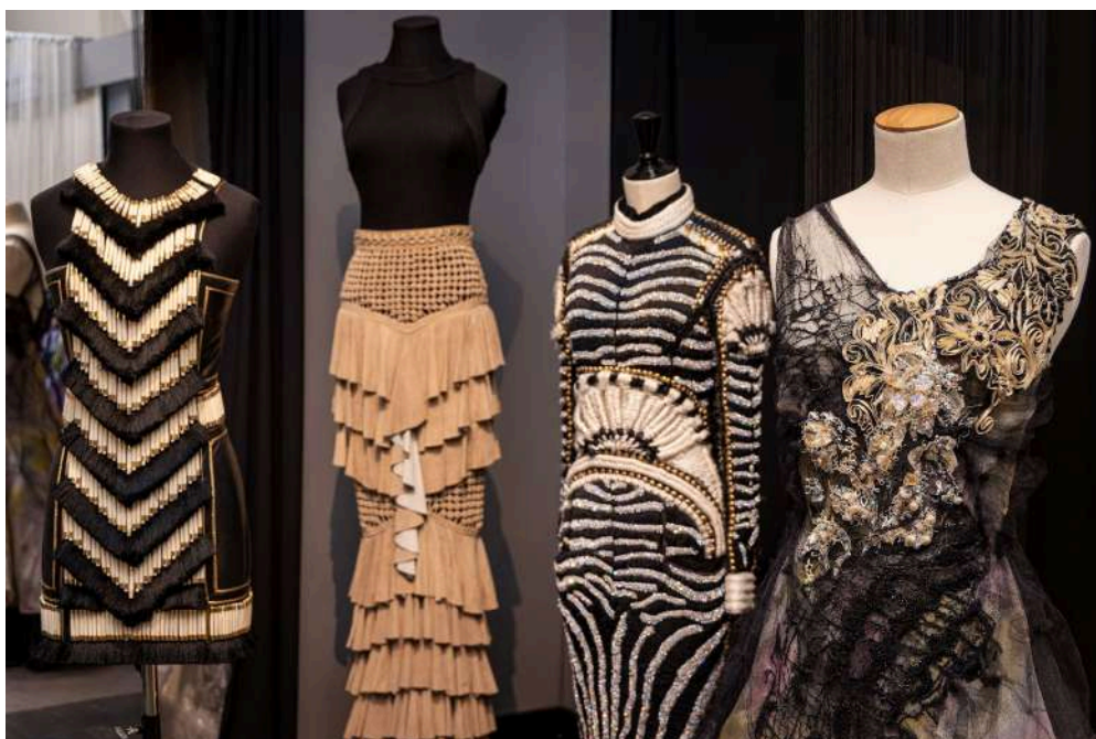
La technique de broderie appelée Point de Lunéville, créée au XIXe siècle, est aujourd'hui en usage dans la mode et la haute couture

C'est au niveau du ministère de la Culture lui-même qu'une approche plus intégrée des patrimoines (naturel, matériel, immatériel) pourrait être encouragée. Les comités d'experts pour le soutien au spectacle vivant pourraient aussi associer des spécialistes des musiques traditionnelles par exemple, afin de mieux apprécier la qualité de l'engagement créatif des artistes qui sollicitent les aides au projet et au conventionnement des compagnies. Cela permettrait de favoriser davantage les réappropriations contemporaines des cultures régionales. Certaines scènes conventionnées d'intérêt national « Art en territoire » comme