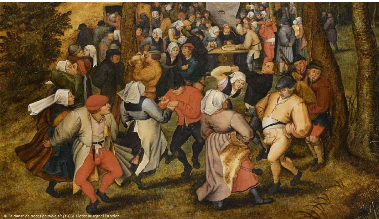
© La danse de noces en plein air (1566) Pieter Brueghel l'Ancien