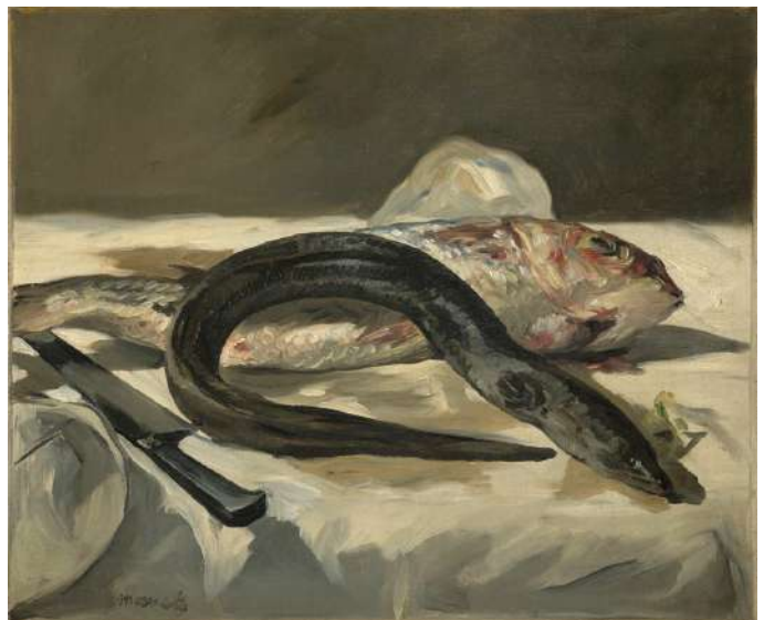
Anguille et rouget (1864) Édouard Manet (1864)