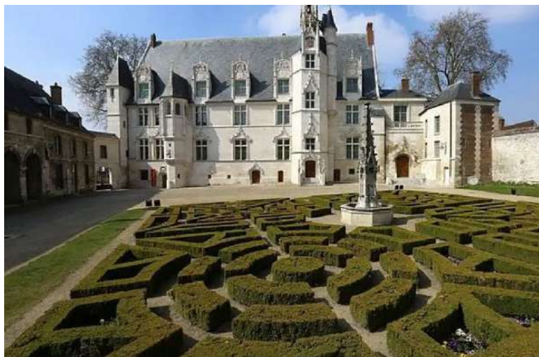
Musée de l'Oise ©MUDO