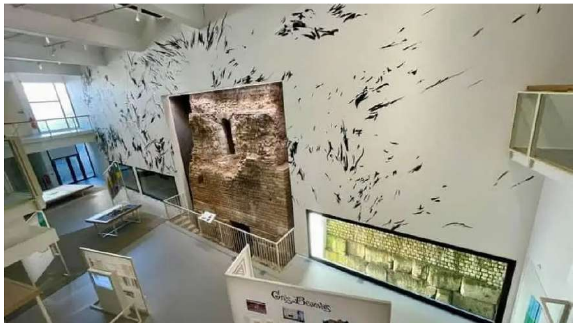
Le Quadrilatère