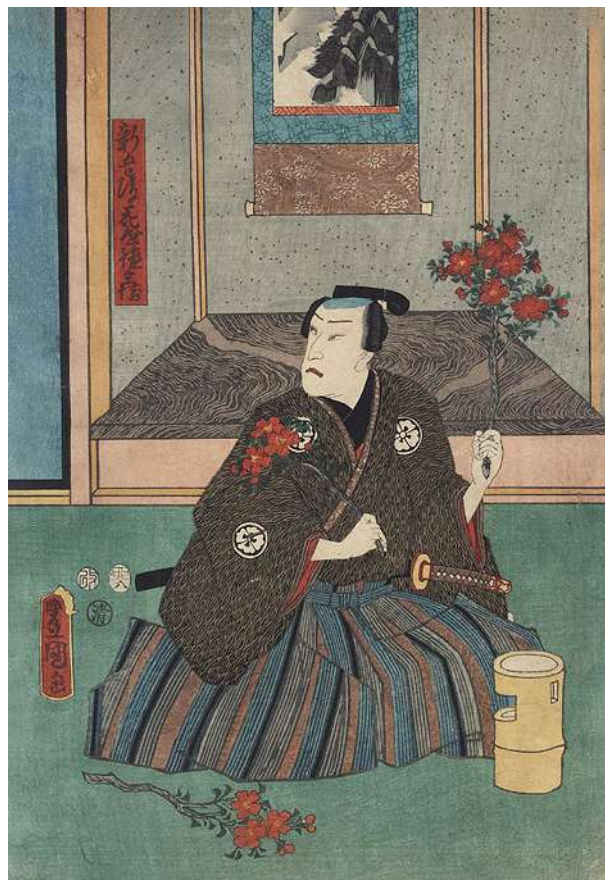
© Composition florale de samouraï par Toyokuni III Kunisada