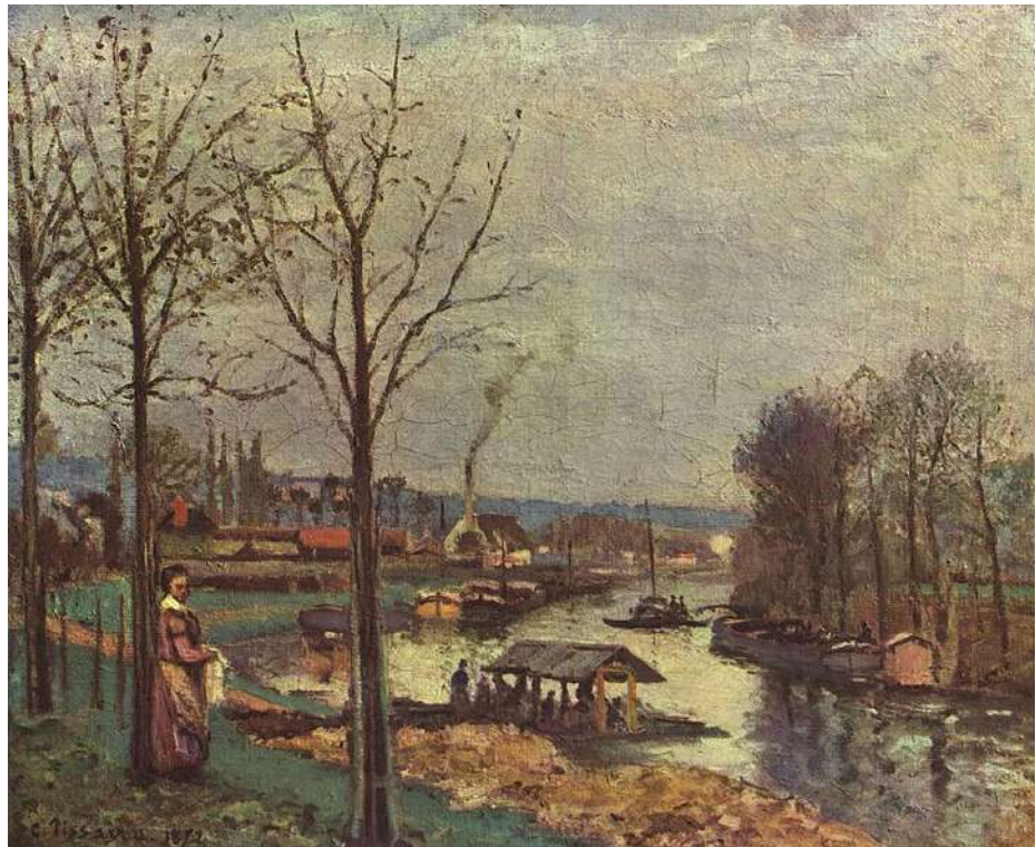
© La Seine à Port-Marly, le lavoir (1872) Pissaro. Musée d'Orsay