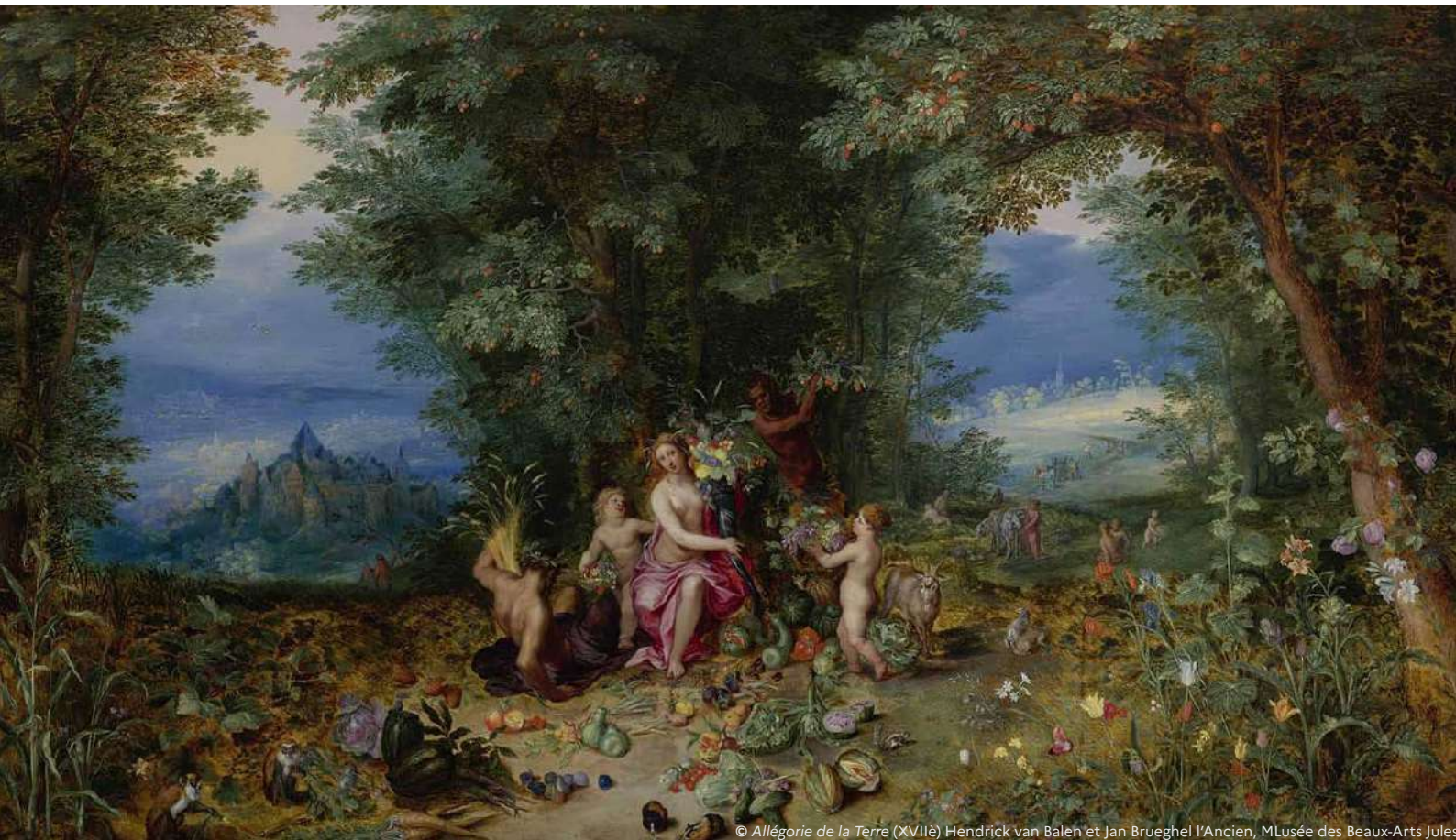
© Allégorie de la Terre (XVII e ) Hendrick van Balen et Jan Brueghel l'Ancien, Musée des Beaux-Arts Jules

« Brueghel & Van Balen, artistes & complices », au musée de Flandre, Cassel (59)