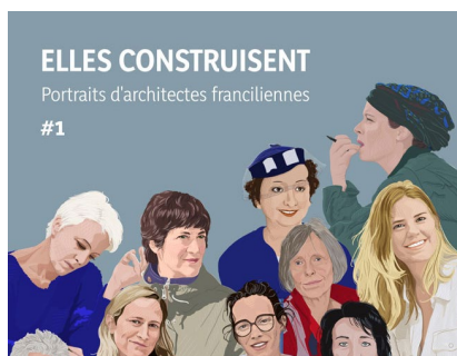
© Aurélie Vanhove / Léa Samson