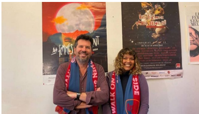
Festival "Les Femmes s'en mêlent"