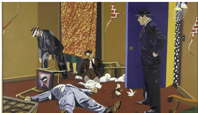
© Adagp, Paris 2024, photo © Bertrand Prévost