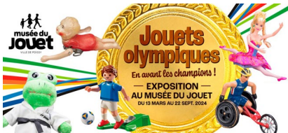
Musée du Jouet de Poissy

Dans le cadre de l'exposition "Jouets olympiques : en avant les champions !", le Musée du Jouet souhaite proposer aux publics des activités culturelles, ludiques et sportives en lien avec la thématique des sports développée dans son parcours au cours de l'été 2024. Un atelier de baby-foot vivant dans le jardin du musée, à l'occasion du passage de la Flamme Olympique à Poissy, une démonstration et initiation de Double dutch (corde à sauter sportive) et d'autres jeux raviront petits et grands.