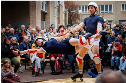
Les Noctambules © Marnik Cathy