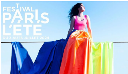
Festival Paris l'été