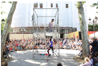
La Lisière

La Lisière est un lieu de création pour les arts de la rue et les arts dans et pour l'espace public, situé dans un espace naturel sensible, le parc du château de Bruyères-le-Châtel. Elle accueille des compagnies en résidence toute l'année, et organise des événements et projets au long cours sur le territoire. À l'occasion de l'Été culturel, La Lisière offre une riche programmation axée autour de spectacles pour tous les publics et de projets participatifs inclusifs. La Section Sport Adapté d'Arpajon de l'AAPISE est notamment invitée à participer à un atelier danse et sport avec la compagnie de danse en espace public Les Passagers.