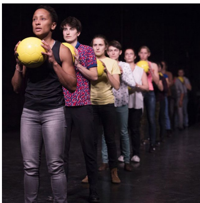
La Parade