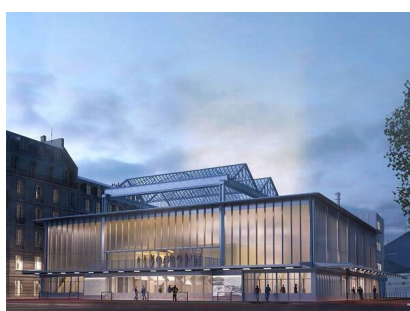
Agence Jouin-Manku pour le futur projet de restauration

"Dans le regard d'Anouk", vue d'artiste réalisée par Marie Jamon, illustratrice scientifique intervenant sur le site archéologique d'Ormesson. Carte de vœux 2024 de la DRAC Île-de-France.