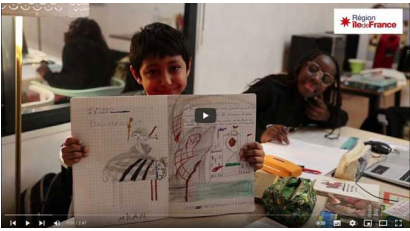
Région Île-de-France © DR