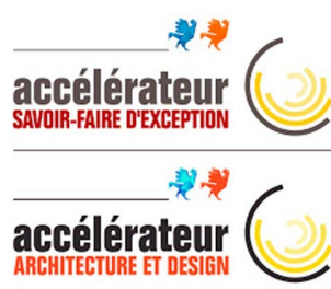
La French touch