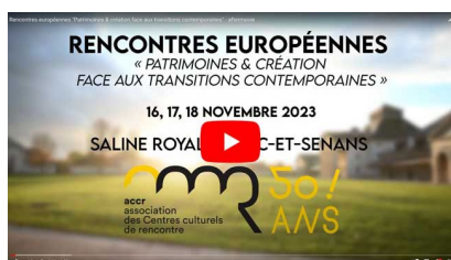
ACCR Europe