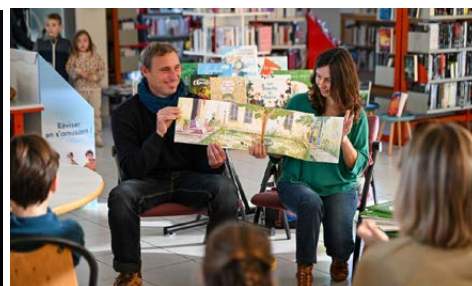
Éditions Poids Plume © Magali Silva