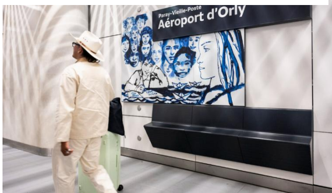
Edmond Baudoin "Jeux d'enfants" - Illustration de la gare Aéroport d'Orly (ligne 14) 2024