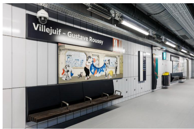
ADAGP Paris 2023 - Matthias Lehmann - Illustration de la gare Villejuif Gustave-Roussy (ligne 14) 2024