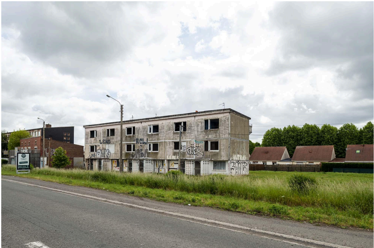
Figure 4 : Le Camus haut d'Annay aujourd'hui