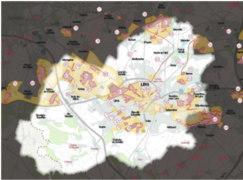
Figure 3 : Miniature du Bassin Minier Patrimoine mondial sur la CA de Lens-Liévin | Mission Bassin Minier

Le Camus haut d'Annay correspond à l'élément n°52