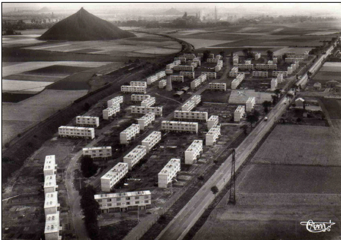
Figure 5 : Carte postale moderne montrant l'ensemble de la cité Leclerc d'Annay-sous-Lens après son achèvement