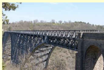
Viaduc du Viaur. Tanus (81)