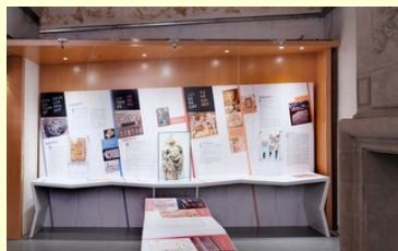
Accueil de l'hôtel Saint-Jean