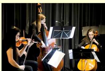
Variations contemporaines – l'isdaT invite le quatuor Béla. © Franck Alix, nov. 2019