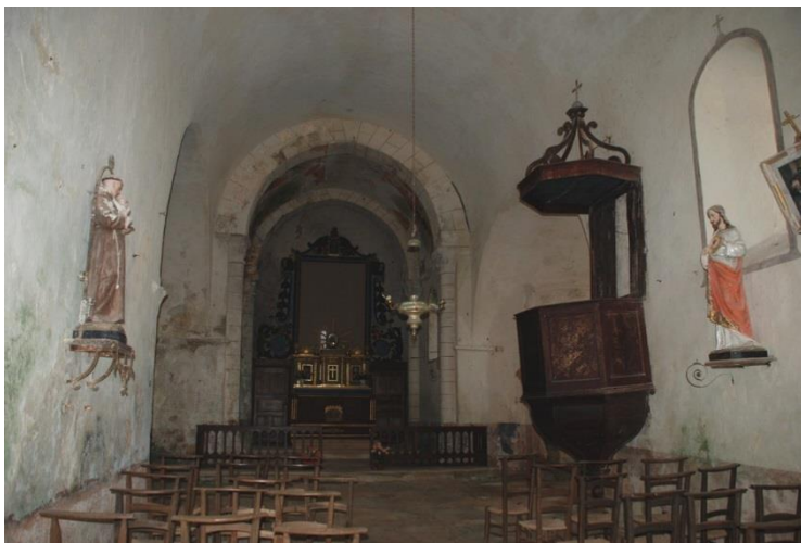
Vues intérieures de l'église