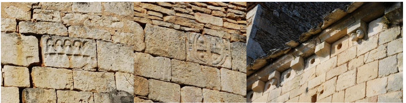
Détails des sculptures du couronnement primitif de la nef et du chevet

L'église Notre-Dame de Pestillac rend lisible l'évolution formelle d'un édifice rural paroissial au Moyen Age ainsi qu'à l'époque moderne. Son implantation, à proximité immédiate avec le castrum de Pestillac, témoigne de la vie de la féodalité rurale et les analogies formelles de cette église paroissiale avec les chapelles du castrum viennent renforcer l'intérêt d'une protection au titre des monuments historiques.