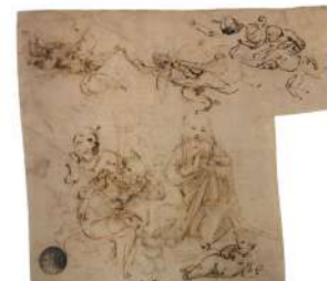
Galleria dell'Accademia, Venezia Leonardo Da Vinci Studio per una Adorazione inv. 256