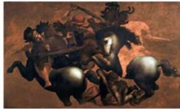
Gallerie degli Uffizi, Firenze Leonardo Da Vinci La Battaglia di Anghiari (copia) inv. 1890, n. 5376