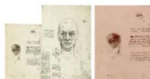
Musei Reali, Torino Leonardo Da Vinci Studi di proporzioni del volto e dell'occhio inv. 15574 e inv. 15576