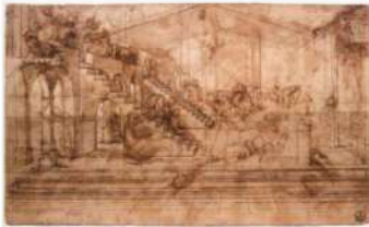
Gallerie degli Uffizi, Firenze Leonardo Da Vinci Studio per l'Adorazione dei Magi inv. 436 E