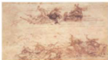
Galleria dell'Accademia, Venezia Leonardo Da Vinci Studio per La battaglia Anghiari inv. 215