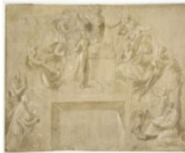
Museo del Louvre, Parigi Raffaello Sanzio Studio per San Giovanni e Giulio II (recto) | Studio per la messa di Bolsena (verso) inv. 3866