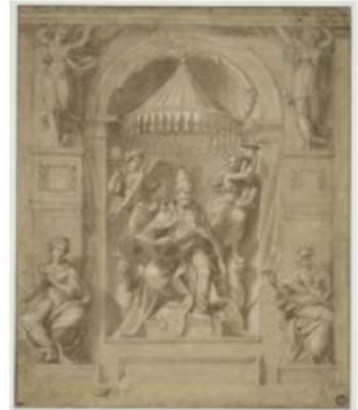
Museo del Louvre, Parigi Giovan Francesco Penni Studio per Papa seduto inv. 4304