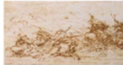
Galleria dell'Accademia, Venezia Leonardo Da Vinci Studio per La battaglia Anghiari inv. 216