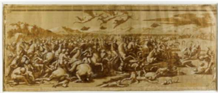
Museo del Louvre, Parigi Giovan Francesco Penni Studio per la Battaglia di Costantino contro Massenzio inv. 3872