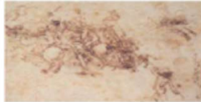
Galleria dell'Accademia, Venezia Leonardo Da Vinci Studio per La battaglia Anghiari inv. 215A