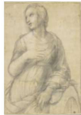
Museo del Louvre, Parigi Raffaello Sanzio Studio per Santa Caterina d'Alessandria inv. 3871