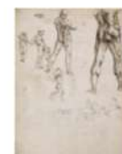
Musei Reali, Torino Leonardo Da Vinci Nudi per la Battaglia di Anghiari inv. 15577