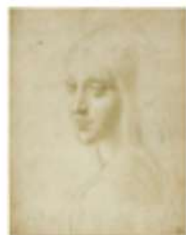
Musei Reali, Torino Leonardo Da Vinci Ritratto di fanciulla, presunto studio dell'angelo della Vergine delle rocce inv. 15572