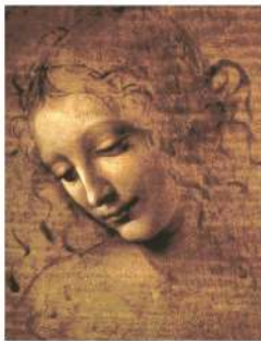
Complesso Monumentale della Pilotta, Parma Leonardo Da Vinci La Scapigliata inv. 362