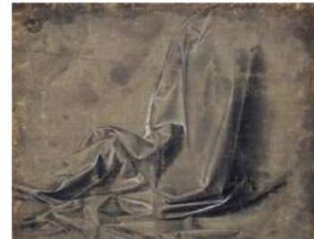
Gallerie degli Uffizi, Firenze Leonardo Da Vinci Studio di panneggio inv. 420 E