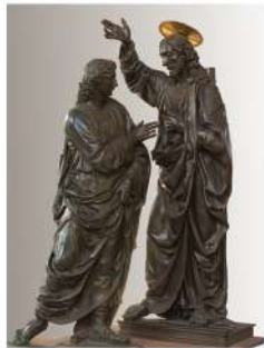
Museo di Orsanmichele (Musei del Bargello), Firenze Andrea del Verrocchio Incredulità di San Tommaso