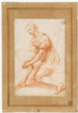
Museo del Louvre, Parigi Raffaello Sanzio Studio per Fanciulla seduta inv. 3862