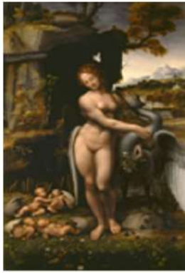
Gallerie degli Uffizi, Firenze Leonardo Da Vinci Leda (copia) inv. 1890, n. 9953