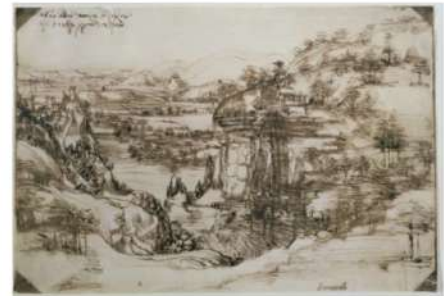
Gallerie degli Uffizi, Firenze Leonardo Da Vinci Studio di Paesaggio inv. 8 P