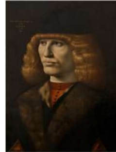
Pinacoteca di Brera, Milano Giovanni Antonio Boltraffio Ritratto di giovane