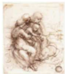
Galleria dell'Accademia, Venezia Leonardo Da Vinci Studio per S. Anna, la Vergine e il Bambino inv. 230