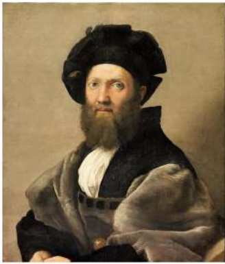
Museo del Louvre, Parigi Raffaello Sanzio Ritratto di Baldassarre Castiglione inv. 611