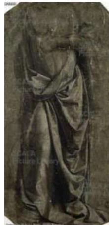
Gallerie degli Uffizi, Firenze Leonardo Da Vinci Studio di panneggio inv. 433 E