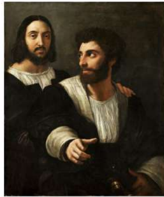
Museo del Louvre, Parigi Raffaello Sanzio Autoritratto con un amico inv. 614