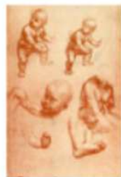
Galleria dell'Accademia, Venezia Leonardo Da Vinci Studio per S. Anna, la Vergine e il Bambino inv. 257