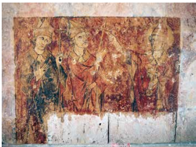
Fig. 4 - Chartres, cathédrale, salle capitulaire, mur ouest : saint Pierre et deux évêques.