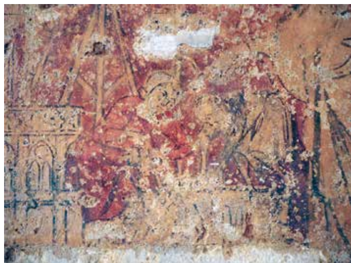
Fig. 6 - Chartres, cathédrale, salle capitulaire, mur ouest : maçons préparant un chargement au pied de la grue.