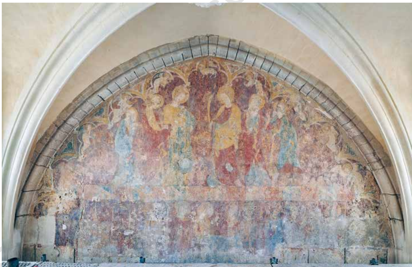
Fig. 9 - Chartres, cathédrale, salle capitulaire, mur ouest : ensemble de la scène peinte.

un large développement de l'iconographie de la construction. Ces représentations sont souvent associées aux scènes de métiers, comme sur les vitraux de Chartres où figurent la plupart des corps de métiers. L'image récemment dégagée force l'intérêt des historiens de la cathédrale, par la précision de la restitution de la façade occidentale, comme par les détails techniques, tel le montage des pierres par la grue à double poulie munie d'une corde. Avec cette représentation se posent de nouveau la chronologie et l'ampleur des travaux du XIV e siècle conduits sur la façade occidentale, qu'évoque l'expertise de 1316 3 . À cette image d'un chantier en cours de construction parfaitement identifiable, il faut rattacher une dimension symbolique notamment dans le contexte de la construction de la chapelle Saint-Piat, à partir de 1320.