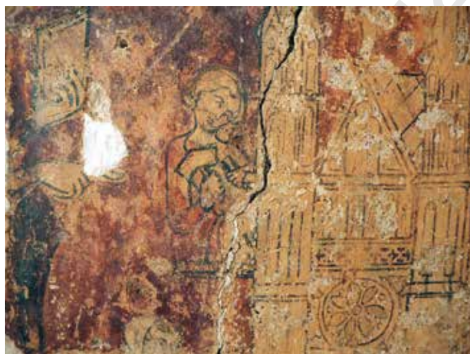
Fig. 5 - Chartres, cathédrale, salle capitulaire, mur ouest : tailleur de pierre maniant le maillet et le ciseau.