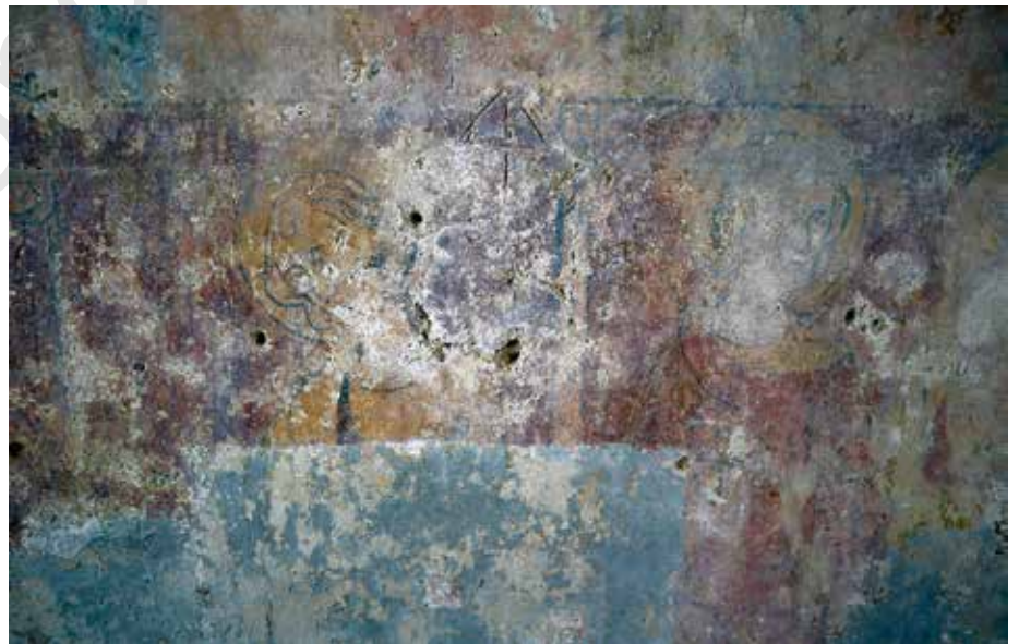
Fig. 1 - Chartres, cathédrale, salle capitulaire sous la chapelle Saint-Piat : marque à l'emplacement d'un trou de boulin bouché sur le mur ouest.

Approche iconographique. L'ensemble du décor historié était unifié par la mise en scène des personnages sur un fond rouge sombre parsemé de fins rinceaux blancs. Chacune des zones historiées était organisée en deux registres séparés par une frise décorative horizontale. Sur les parois est et ouest, le décor, construit en miroir, s'inscrivait dans une fausse architecture