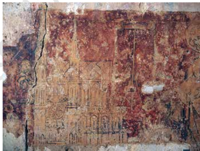
Fig. 7 - Chartres, cathédrale, salle capitulaire, mur ouest : cathédrale en cours de construction.

de quatre cardinaux, encadrés par des hommes d'armes, convergent vers un personnage portant une tiare, assis sur un trône et levant la main en signe de bénédiction; au sud, la scène est très lacunaire, mais on distingue assez clairement un chanoine coiffé d'une aumusse de forme rectangulaire, debout devant une architecture.