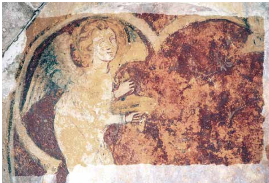
Fig. 2 - Chartres, cathédrale, salle capitulaire, mur est : détail d'un ange.

composée d'arcs trilobés occupés par de petits personnages : anges musiciens ou thuriféraires (fig. 2), buste du Christ bénissant et agneau nimbé. Au registre haut, on identifie aisément une Annonciation au sud et un Couronnement de la Vierge au nord. L'interprétation des deux autres scènes est plus délicate : à l'est, trois femmes tenant chacune un livre s'avancent vers un personnage auréolé couché dans un lit sur lequel est posée une mitre (fig. 3) ; à l'ouest, la Vierge fait face à un homme nimbé portant une palme ; ils sont entourés à gauche par deux femmes tenant un livre, et à droite par un couple âgé.