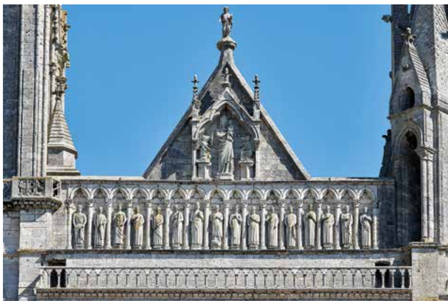
Fig. 8 - Chartres, cathédrale, façade ouest : galerie des rois, Vierge à l'Enfant et Christ montrant ses plaies.

un large développement de l'iconographie de la construction. Ces représentations sont souvent associées aux scènes de métiers, comme sur les vitraux de Chartres où figurent la plupart des corps de métiers. L'image récemment dégagée force l'intérêt des historiens de la cathédrale, par la précision de la restitution de la façade occidentale, comme par les détails techniques, tel le montage des pierres par la grue à double poulie munie d'une corde. Avec cette représentation se posent de nouveau la chronologie et l'ampleur des travaux du XIV e siècle conduits sur la façade occidentale, qu'évoque l'expertise de 1316 3 . À cette image d'un chantier en cours de construction parfaitement identifiable, il faut rattacher une dimension symbolique notamment dans le contexte de la construction de la chapelle Saint-Piat, à partir de 1320.