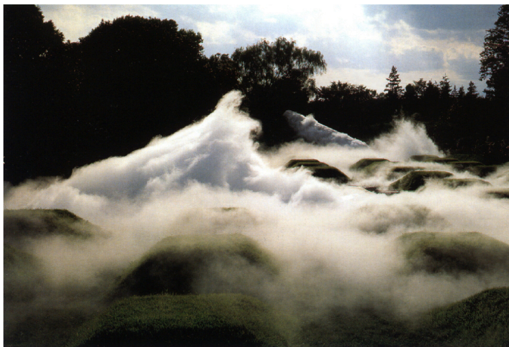
Fujiko Nakaya « dans le brouillard, ce qui est visible devient invisible, et ce qui est invisible — comme le vent — devient visible »