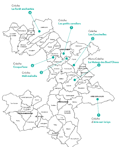
Carte des 9 EAJE (Etablissement d'accueil du jeune enfant) de la CAPSO

Elle dispose au total de 155 places d'accueil collectif soit 417 enfants accueillis en 2022 et accompagne environ 600 assistants maternels actifs.