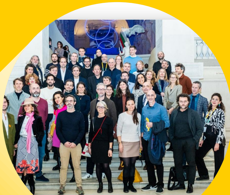
Lancement de la promotion au Musée des Arts Décoratifs