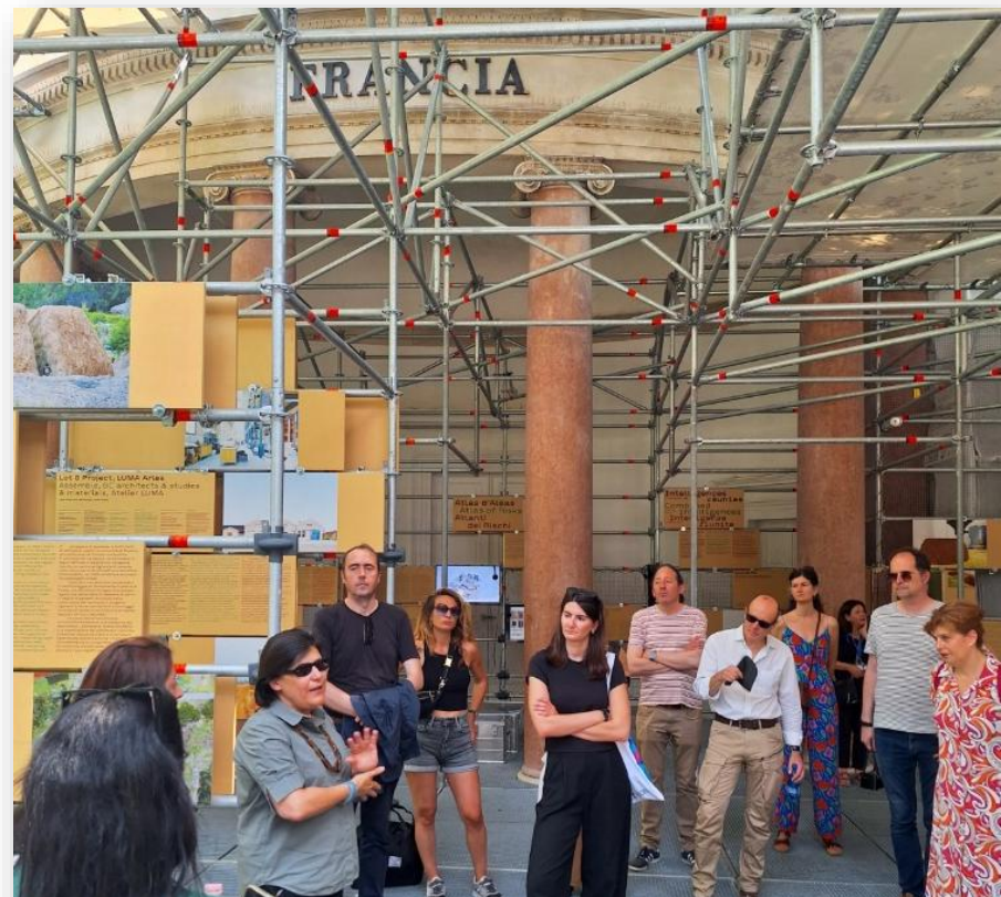
Visite privée du Pavillon Français de la Biennale d'Architecture et de Design