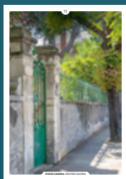
11 les clôtures

Chaque intervention sur les façades de nos centres anciens compte et participe à l'harmonie du paysage urbain. Au cœur de nos villes et villages, l'intérêt particulier et l'intérêt général doivent être conjugués pour créer le cadre de vie que nous y recherchons tous.