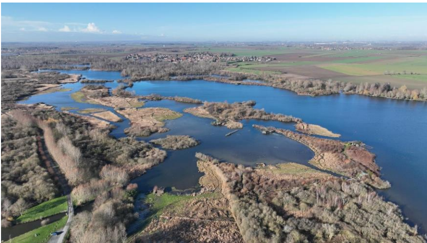
Vue aérienne d'une commune du territoire

En savoir plus sur l'action culturelle et territoriale de la DRAC Hauts-de-France : https://www.culture.gouv.fr/Regions/Drac-Hauts-de-France/La-DRAC