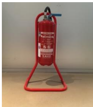
Extincteur à eau sur socle