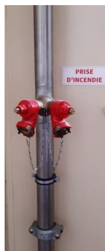
Colonne sèche dans une cage d'escalier, avec 2 raccords de refoulement