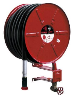
Robinet d'incendie armé

La manipulation des RIA, moins aisée que celle des extincteurs portatifs, doit faire l'objet de formations et d'exercices réguliers , au bénéfice des agents en charge de leur mise en œuvre. Les informations correspondantes sont consignées dans le registre de sécurité.