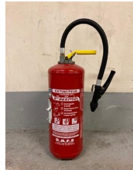
Extincteur à poudre ABC