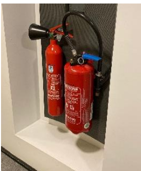
Extincteurs CO2 et à eau, accrochés au mur