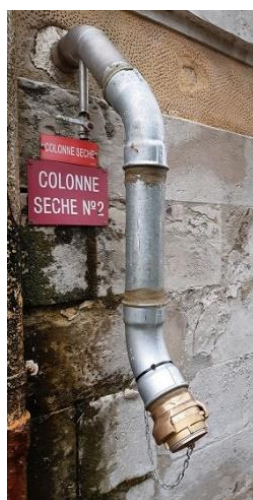
Raccord d'alimentation de colonne sèche en façade