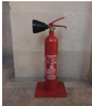
Extincteur CO2 sur socle