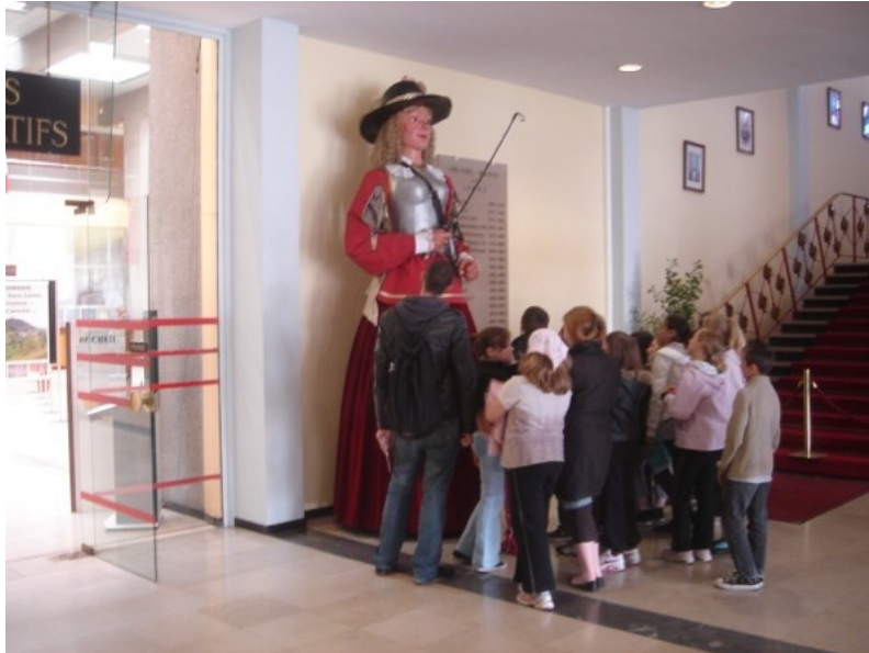
La géante conservée et présentée à l'entrée de la Mairie de Lomme