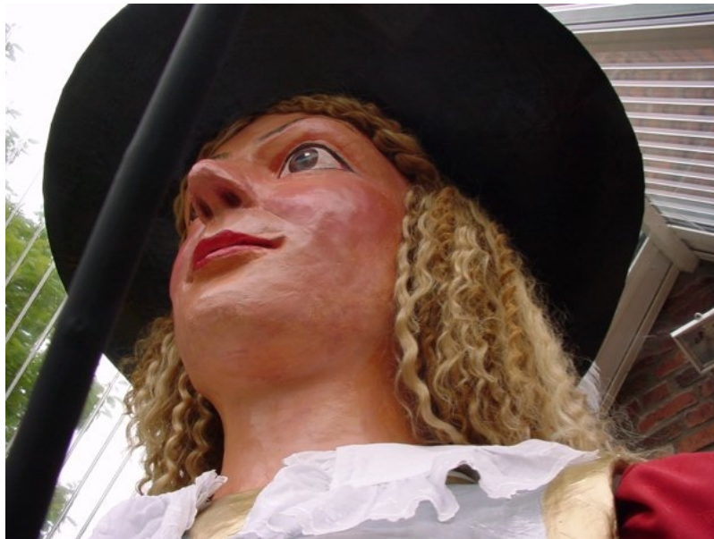
Tête de la géante

Lorsque la géante ne participe pas au défilé, elle est présentée dans le grand hall d'accueil de l'hôtel de Ville où elle semble monter la garde.