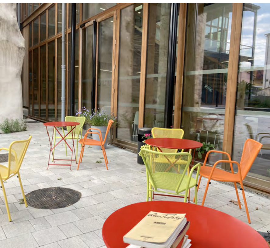
Médiathèque Confluence – Lodève