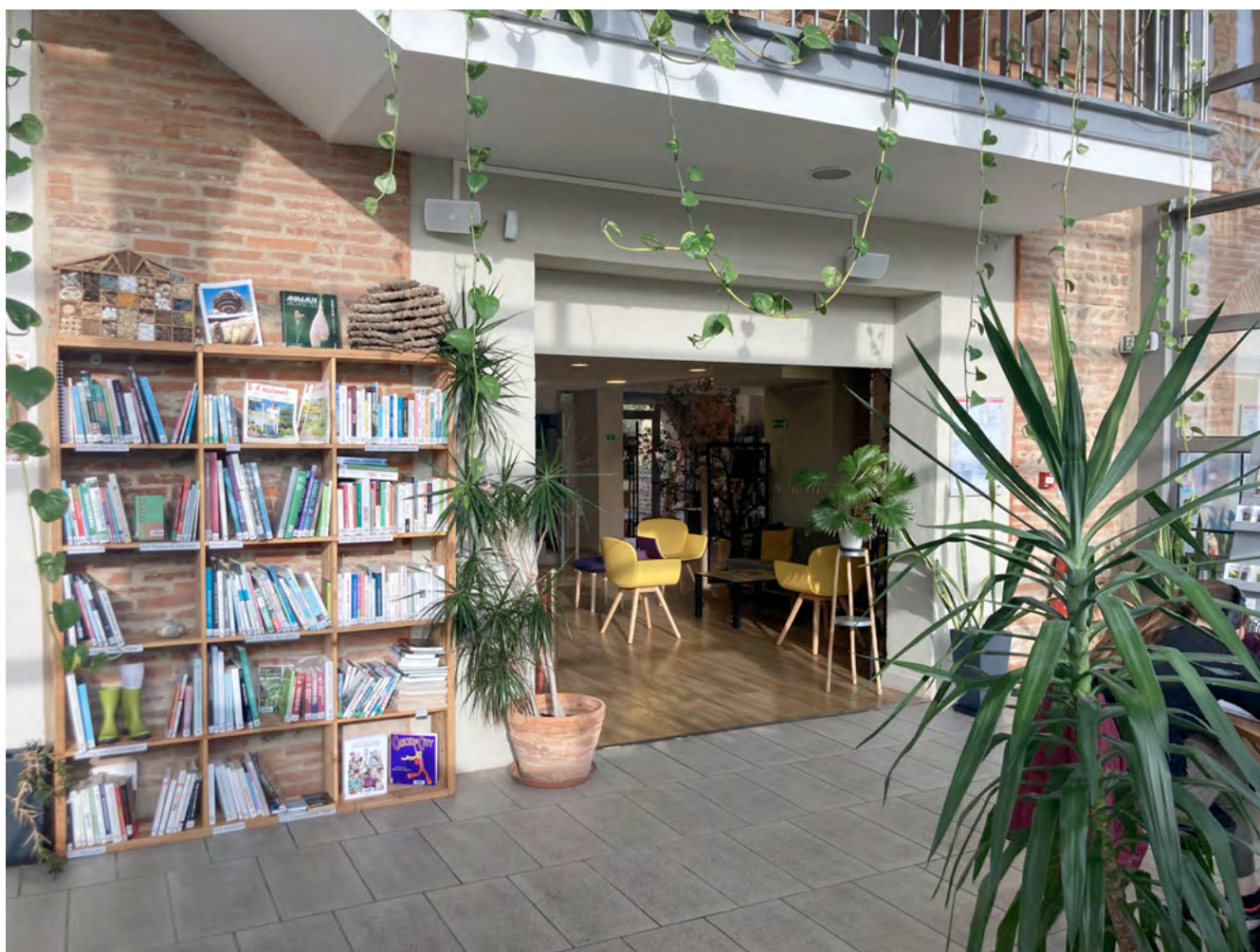
Médiathèque le Moulin de Roques

Le ministère de la Culture publie régulièrement des études et documents de référence : on signalera par exemple l'étude Comment apprécier les effets de