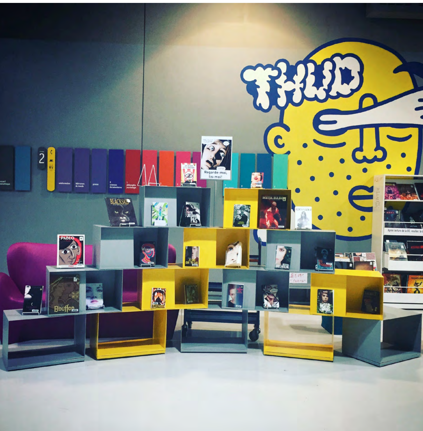
Bibliothèque publique d'information - Paris - Photo Charlotte Henard CC-BY-SA