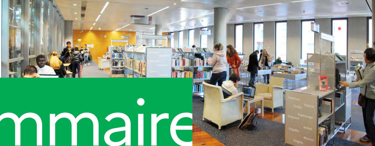
J. Cabanis – Toulouse