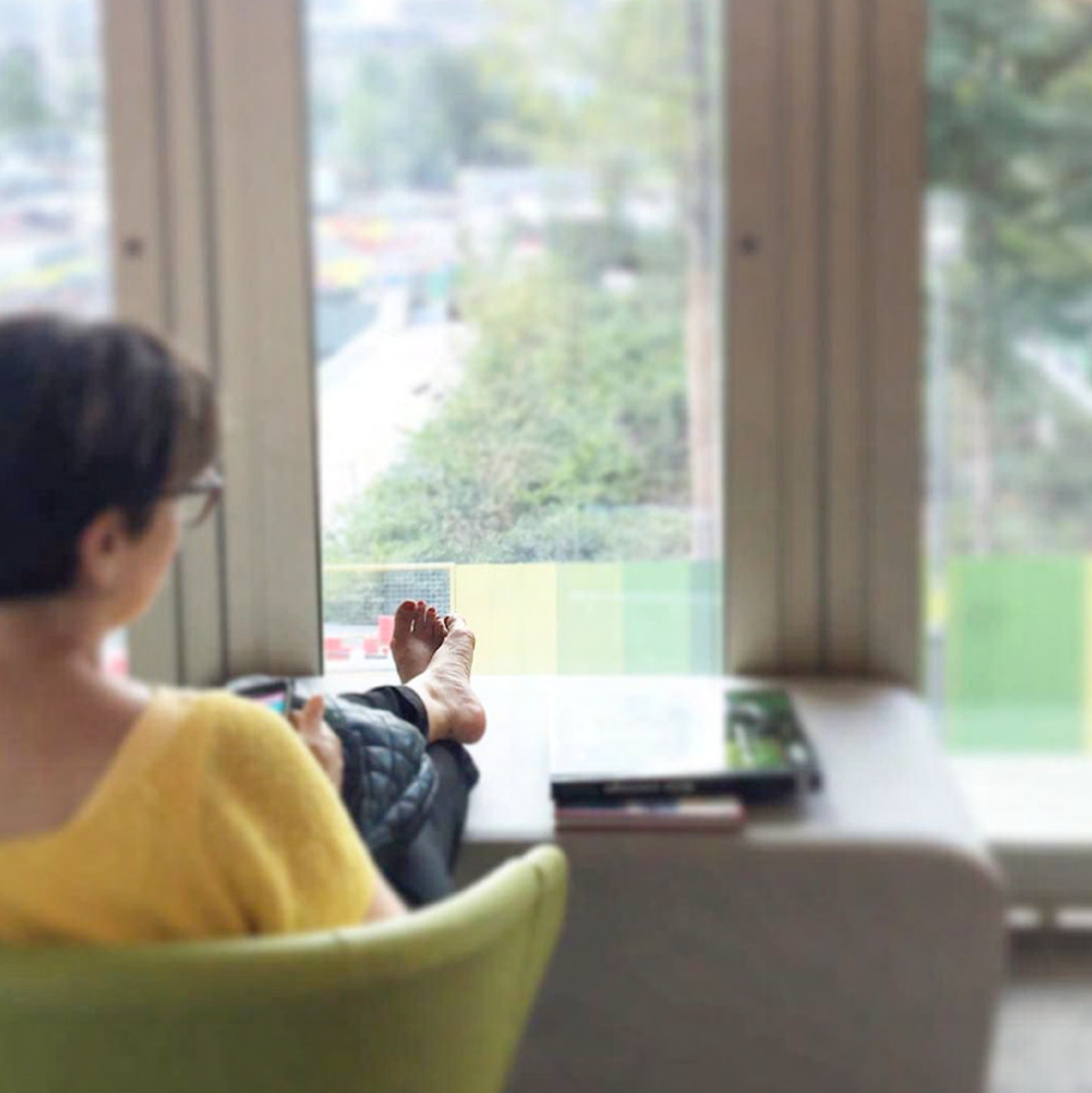
Médiathèque La Canopée - Paris