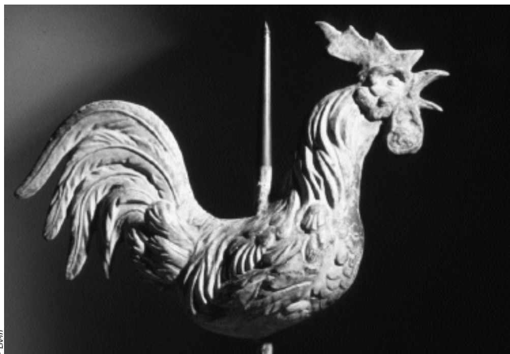
Coq de clocher en cuir repoussé in Préserver les objets de son patrimoine.

Inventaire par Marie-Françoise Limon Paris, Centre historique des Archives nationales, 2001, 86p., 80F.