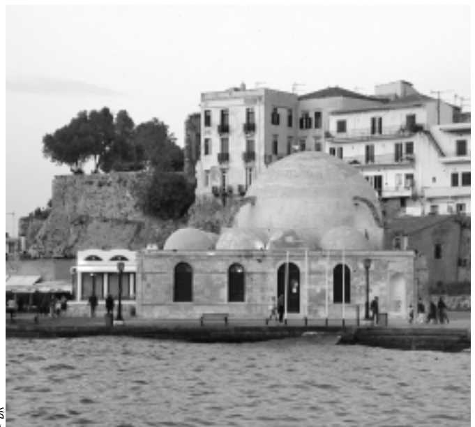
Le port de La Canée (Crète) : la mosquée turque.

Ce projet répond à une triple volonté. Il s'agit tout d'abord de remédier aux mauvaises conditions actuelles dans lesquelles est placé le MNATP-CEF, et qui l'ont progressivement marginalisé alors qu'il a été, de plusieurs points de vue, l'un des établissements muséographiques les plus novateurs et les plus admirés au monde dans la décennie qui a suivi son installation par son créateur Georges-Henri Rivière et son architecte, Jean Dubuisson. Ce musée est en effet, au Bois de Boulogne, très mal situé par rapport à son public potentiel francilien et touristique, à l'étroit dans ses murs et sans possibilité d'extension alors que son programme initial, jamais réalisé, prévoyait un musée de plein air