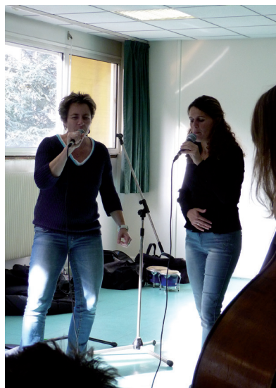
Répétition 2©C'est Mon aiR-2015