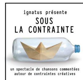
Sous la contrainte©Ignatus