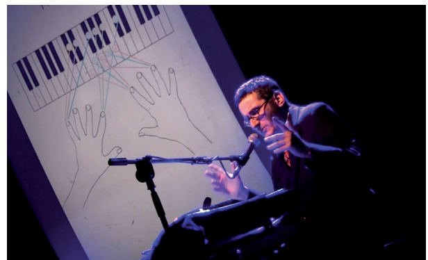
Le Paradis - Sous la contrainte©Ignatus