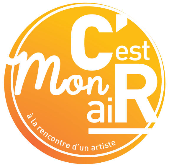
Logo©C'est Mon aiR-2015

Pour illustrer vos articles, vous trouverez ci-dessous une sélection de visuels à demander à communication@lescmr.asso.fr .