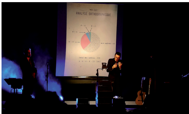
Sous la contrainte©Ignatus