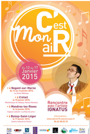
Affiche©C'est Mon aiR-2015