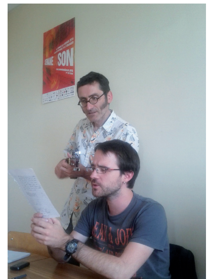
Séance d'écriture