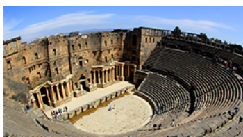
ville de Bosra, en Syrie

< https://www.service-public.fr/particuliers/vosdroits/F1435 > (consulté le 10 juillet 2019).