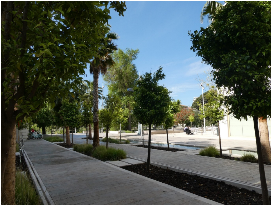
© Brigitte Larroumec - CRMH/DRAC PACA 2022