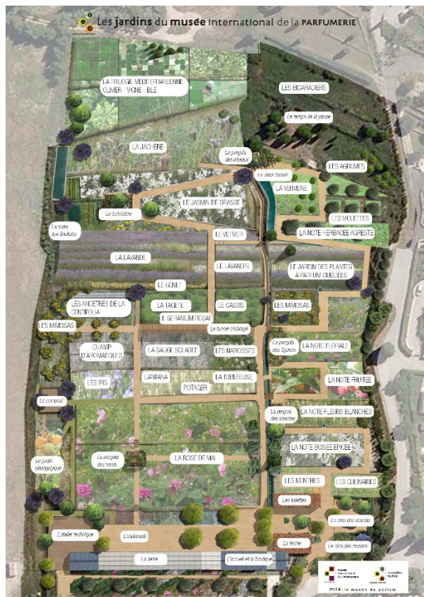
Plan des jardins du MIP