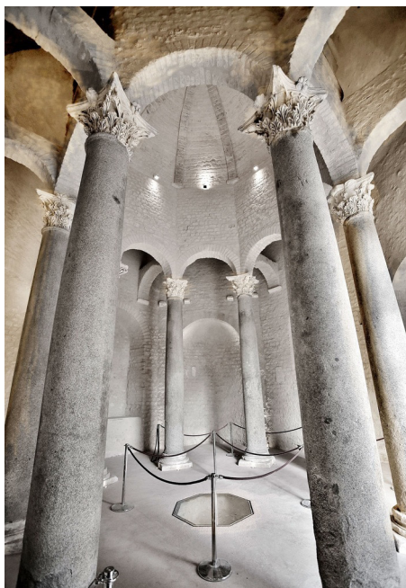
Riez visite Cathédrale

Animations : Visite commentée. dimanche 22/09 - 11h à 12h Tél : 04 92 77 99 09