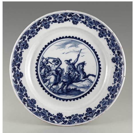
Moustiers-sainte-Marie Musée de la faïence