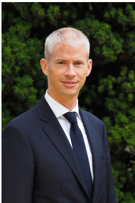
Franck Riester