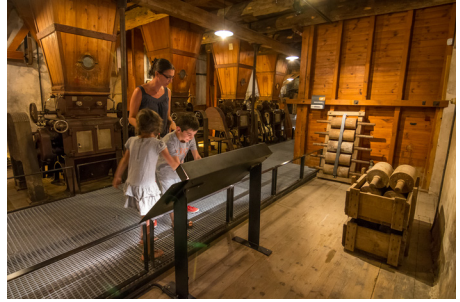
La Mure Argens Minoterie