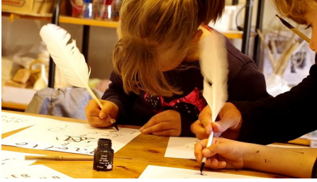
Castellane atelier enluminure © Remi Nigri

http://www.maison-nature-patrimoines.com