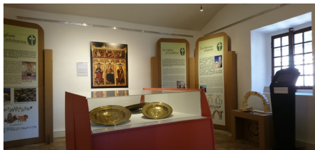
Castellane maison patrimoine

samedi 21 et dimanche 22/09 - 10h à 18h30