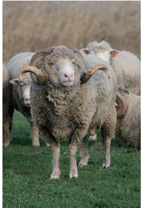
La Mure Argens Minoterie

Tél : 06 79 01 78 25 - http://www.secrets-de-fabriques.fr/musees-et-parcours/la-minoterie-de-la-mure-argens