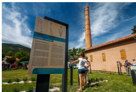
Barreme distillerie