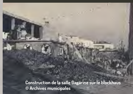
Construction de la salle Gagarine sur le blockhaus