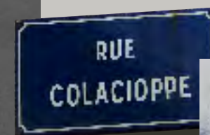
Robert Colacioppe, résistant port de boucain

Visite de groupes sur rendez-vous au 04 42 40 65 91