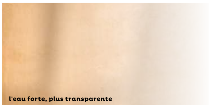
l'eau forte, plus transparente