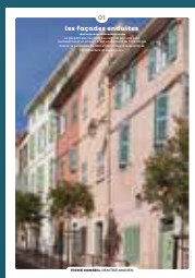
01 Les façades enduites

Qu'ils fassent ou non l'objet d'une protection, les centres anciens sont toujours des espaces de qualité. Chaque intervention sur les façades ou sur les toitures compte et participe à l'harmonie du paysage urbain. Au cœur de nos villes et villages, l'intérêt particulier et l'intérêt général doivent être conjugués pour créer le cadre de vie que nous y recherchons tous.