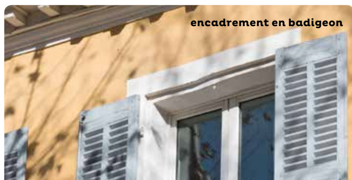
encadrement en badigeon

Sur un support ciment existant, prévoyez une peinture à liant minéral, plus compatible avec ce matériau.