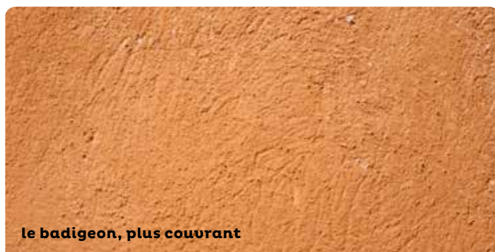
le badigeon, plus couvrant

Le fond de façade en enduit doit être vérifié par un examen attentif. Analysez les teintes de badigeons existantes avant restauration ou décroûtage. Consultez un professionnel (artisan-maçon ou architecte) pour le diagnostic, le suivi et la réalisation des travaux.