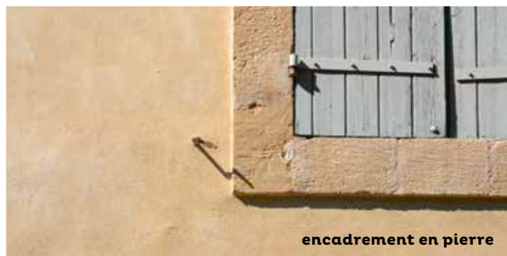
encadrement en pierre