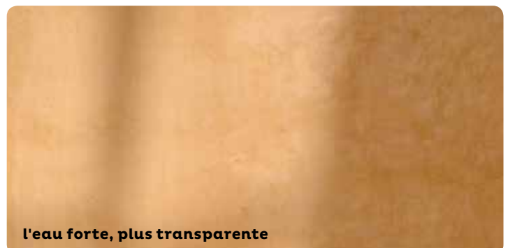
l'eau forte, plus transparente