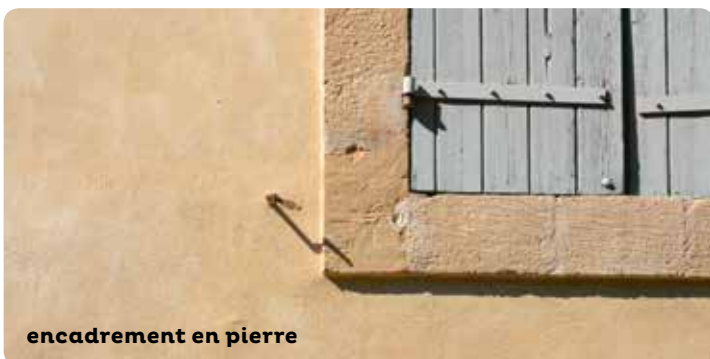
encadrement en pierre