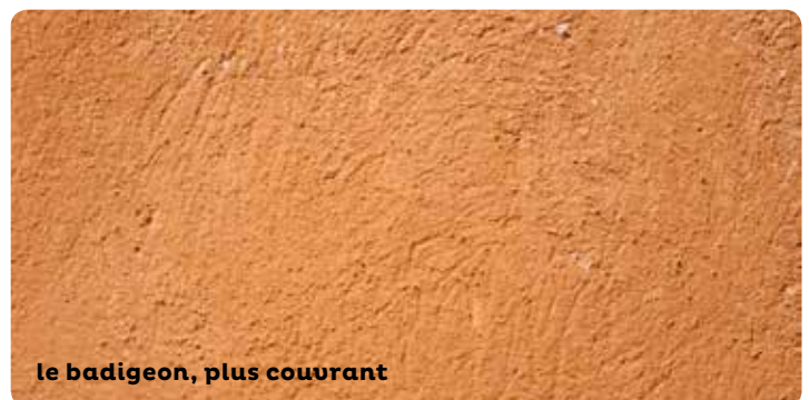
le badigeon, plus couvrant

Le fond de façade en enduit doit être vérifié par un examen attentif. Analysez les teintes de badigeons existantes avant restauration ou décroûtage. Consultez un professionnel (artisan-maçon ou architecte) pour le diagnostic, le suivi et la réalisation des travaux.