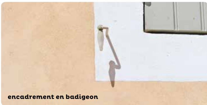
encadrement en badigeon

Sur un support ciment existant, prévoyez une peinture à liant minéral, plus compatible avec ce matériau.