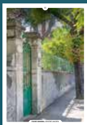
11 les clôtures

Chaque intervention sur les façades de nos centres anciens compte et participe à l'harmonie du paysage urbain. Au cœur de nos villes et villages, l'intérêt particulier et l'intérêt général doivent être conjugués pour créer le cadre de vie que nous y recherchons tous.