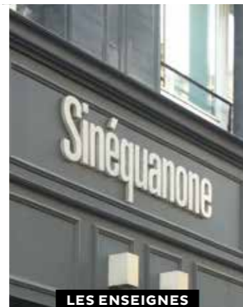
LES ENSEIGNES EN APPLIQUE