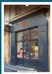
18 les devantures commerciales en applique