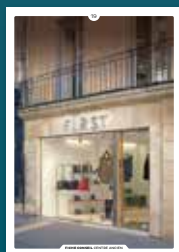
19 les devantures commerciales en feuillure

Chaque intervention sur les façades de nos centres anciens compte et participe à l'harmonie du paysage urbain. Au cœur de nos villes et villages, l'intérêt particulier et l'intérêt général doivent être conjugués pour créer le cadre de vie que nous y recherchons tous.