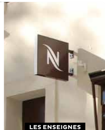
LES ENSEIGNES EN DRAPEAU