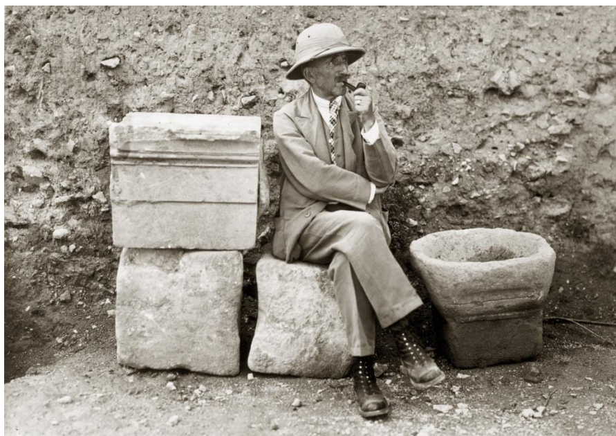
Pierre de Brun