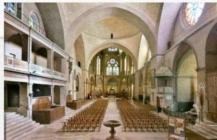
Nef de la cathédrale Saint-Étienne