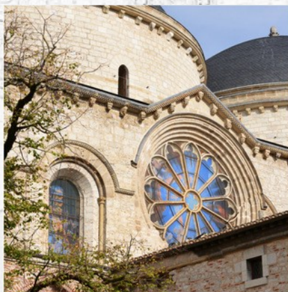
Rose vue de l'extérieur