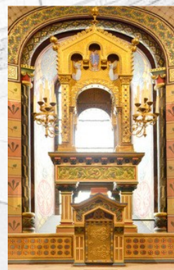
Monstrance de la chapelle d'axe