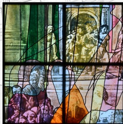
Détail de la baie 116