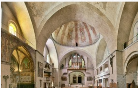
Nef de la cathédrale Saint-Étienne