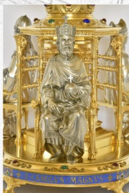
Détail du reliquaire de la Sainte Coiffe