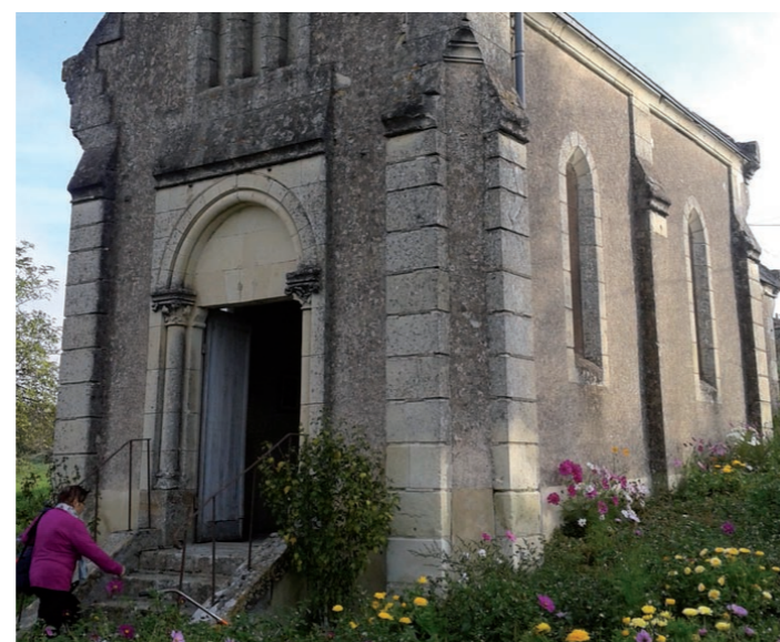
© Hameau de Prailles - situé sur la commune de Saint-Martin-de-Sanzay

Venez apprécier une visite guidée et une présentation de l’orthodoxie. La chapelle est située sur l sentier ‘Entre bois et hameaux’. Ouverture exceptionnelle.