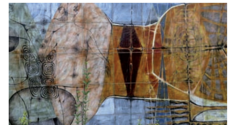
Lave émaillée de Pierre Saint-Paul - 1964 - Lycée G.Sand - Nérac

Le CAUE 47 et le lycée G.Sand organise un parcours commenté (à pied) en 4 étapes d'un quartier aménagé à la périphérie nord de Nérac au début des années 1960. Première participation.