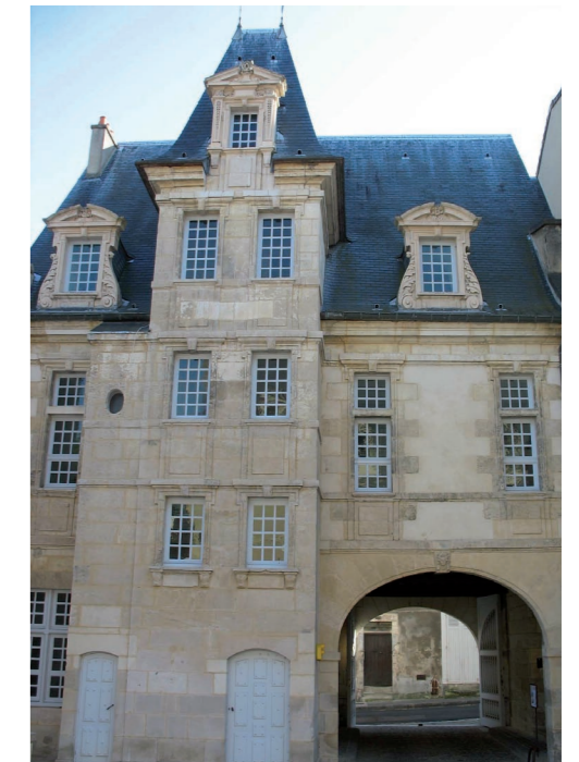
Hôtel de Rochefort

DRAC NOUVELLE-AQUITAINE - SITE DE POITIERS 102 GRAND'RUE, 86020 POITIERS 05 49 36 30 30