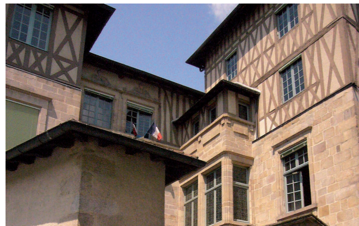
Hôtel Maledent de Feytiat

DRAC NOUVELLE-AQUITAINE - SITE DE BORDEAUX 54 RUE MAGENDIE, 33074 BORDEAUX 05 57 95 02 02