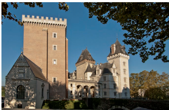
Château de Pau

Animation type «escape-game», groupe de 2 à 6 joueurs. Inscription à l'adresse contact@francas64.fr jusqu'au 13/9 et sur place ½ h avant les séances (sous réserve de places restantes).