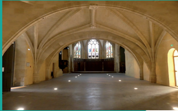
Chapelle Couvent de l'Annonciade