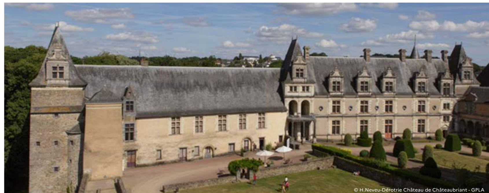
Château de Châteaubriant - GPLA

Spectacle extérieur : concert dessiné avec Zeï & cie, Julien Behar au saxophone et machines, Stéphane Decolly à la basse électrique et Christophe Forget aux dessins -projetés en direct - est prévu. 20h30-22h