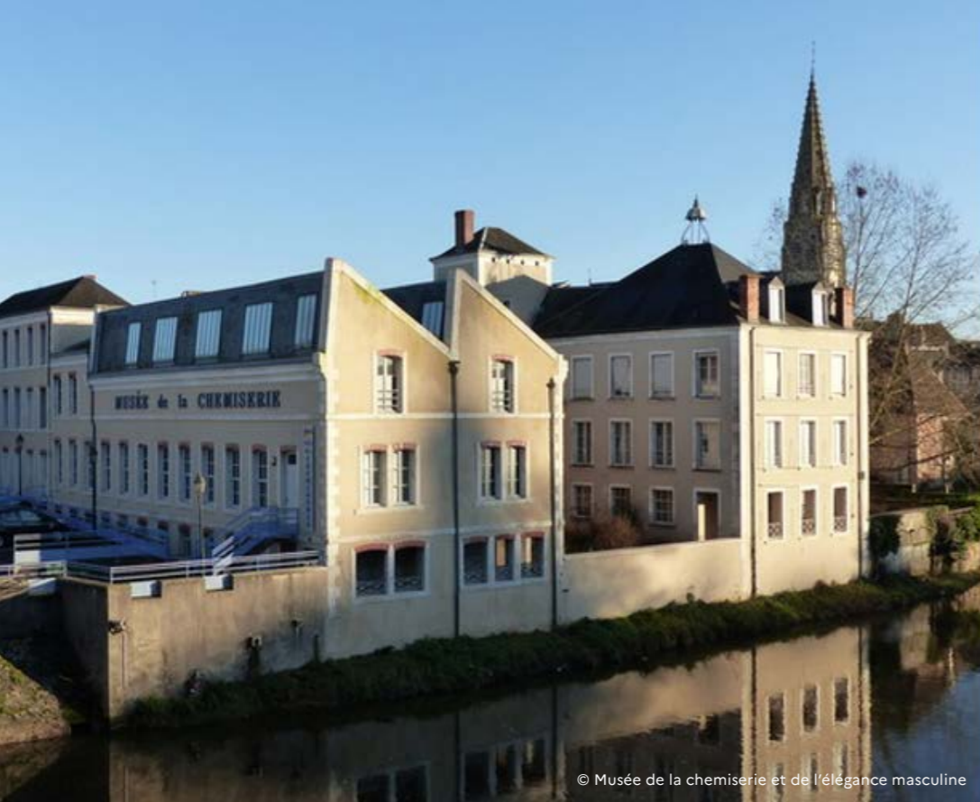
© Musée de la chemiserie et de l'élégance masculine