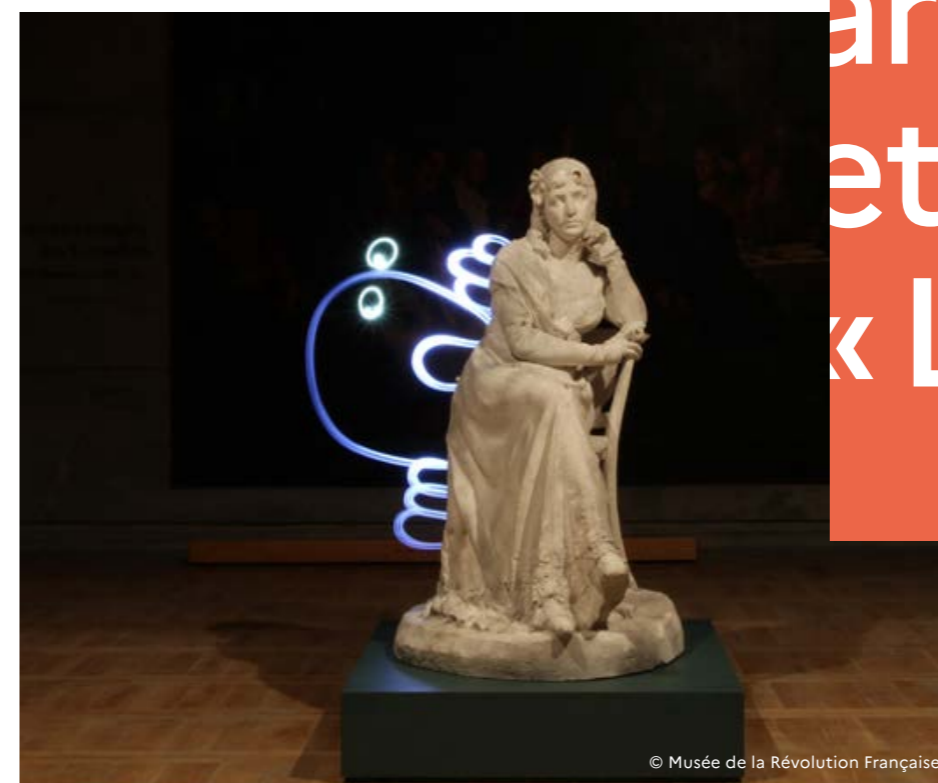
© Musée de la Révolution Française

Spectacle : ce musée accueille une des plus belles collections françaises d'art oriental – Japon, Chine, Asie du Sud Est, Inde, Tibet, Népal – ainsi qu'une importante collection d'antiquités égyptiennes. Fondé en 1893 par Georges Labit, il présente une architecture d'inspiration mauresque dans le style des villas exotiques alors à la mode. Trois écoles d'arts martiaux de Toulouse proposent des démonstrations de Kendo et d'Aïkido, arts martiaux traditionnels japonais, dans les jardins du musée.