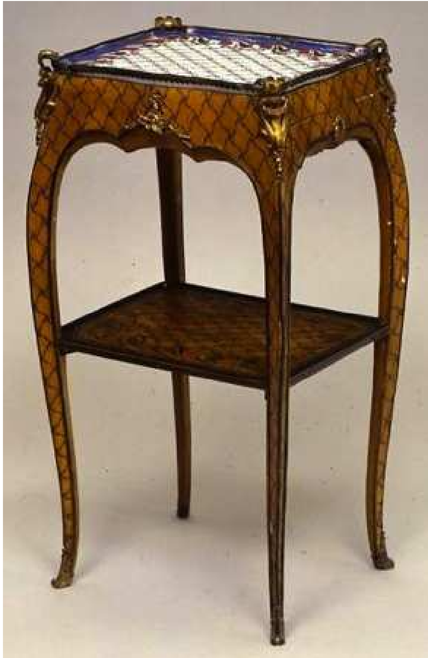
Table cabaret Plateau courteille Porcelaine de Sèvres Ebéniste Roger Vandercruse