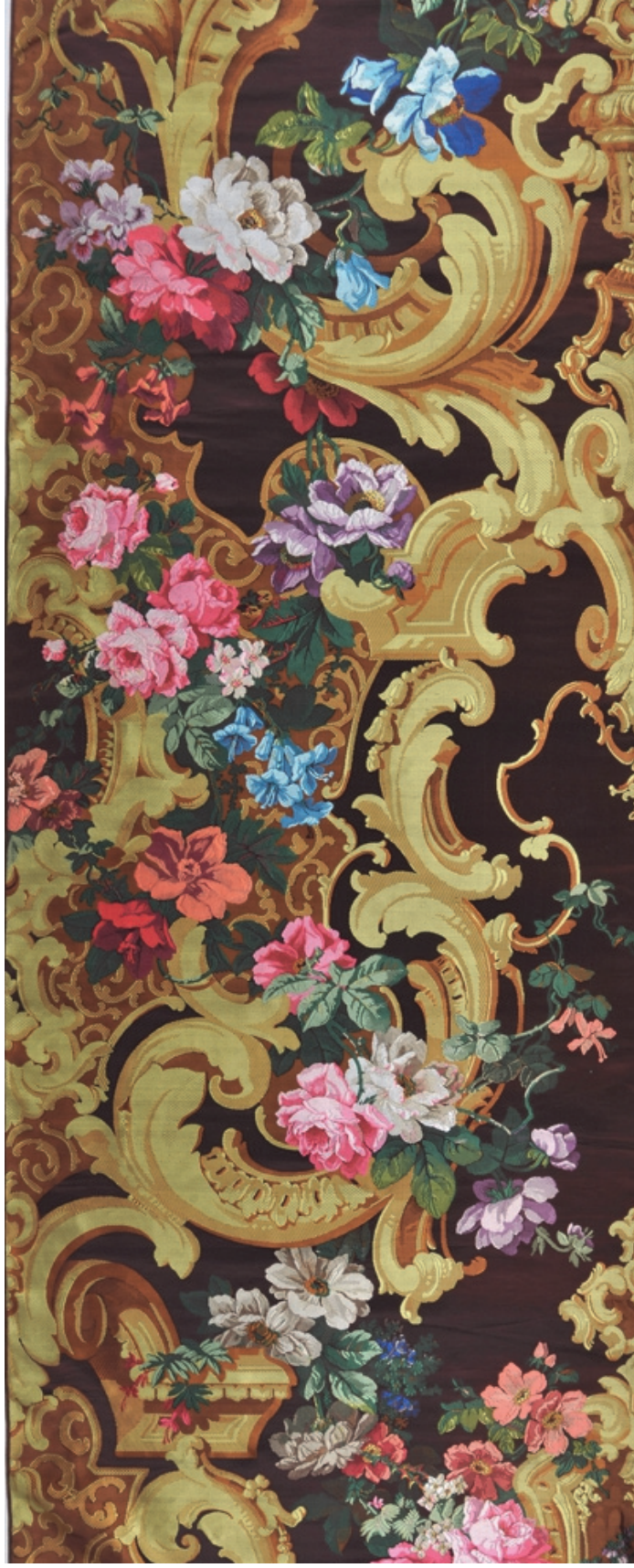
Elément de Tenture de la Chambre à coucher de l'empereur à Saint Cloud Attribué à MATHEVON et BOUVARD, 1855 4,30 x 0,81 m Mobilier national