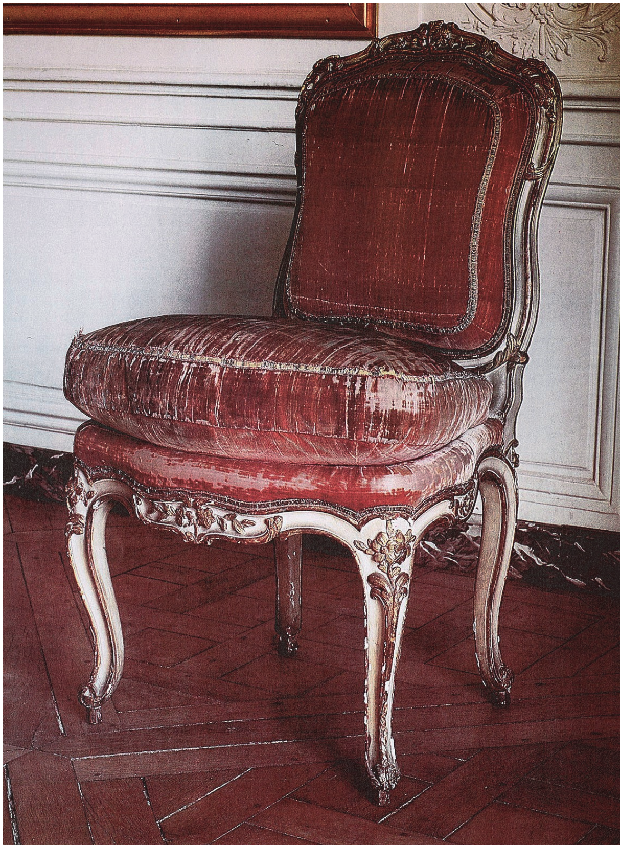
Chaise à la reine bois laqué aux sculptures et moulures rehaussées de dorure. Fond à coussin, garnitures pouvant être d'origine, couverture en velours de soie. (Château de Versailles)