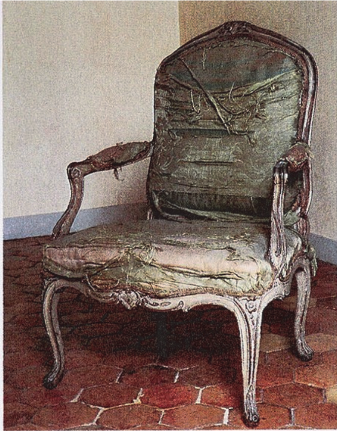
Fauteuil à la reine bois peint, garnitures du XIX e siècle, couvert de damas qui pourrait être attribué à TILLARD.