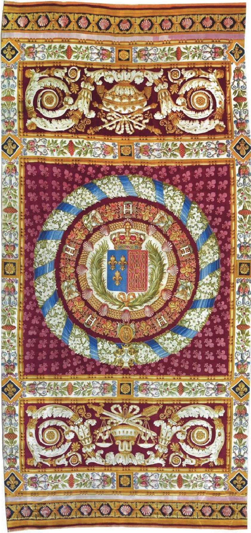
Partie centrale du tapis de la salle du trône des Tuileries, D'après Jean-Démsthène DUGOURC, 1822 Manufacture de la Savonnerie 10.07 x 4.6 m Mobilier national en dépôt au Musée du Louvre