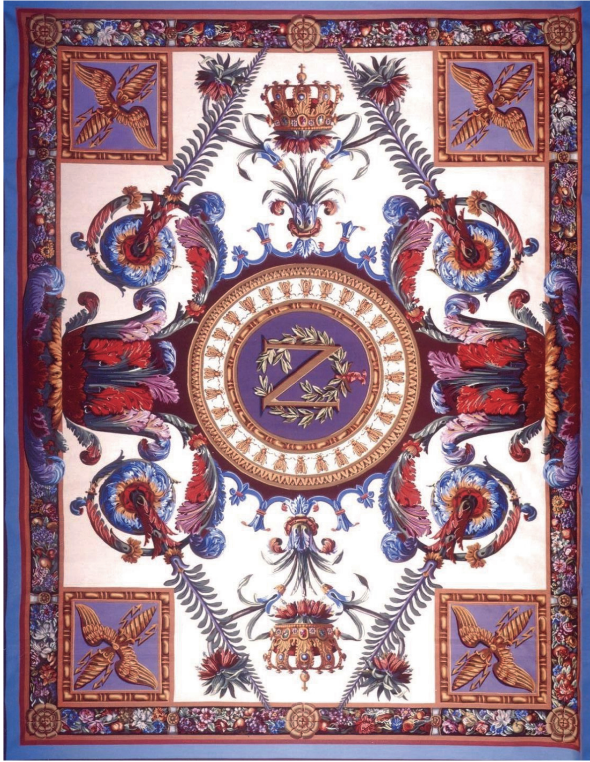
Tapis ras D'après un modèle de Charles PERCIER pour la salle du trône aux Tuileries de 1807 Manufacture des Gobelins, 1971 Mobilier national