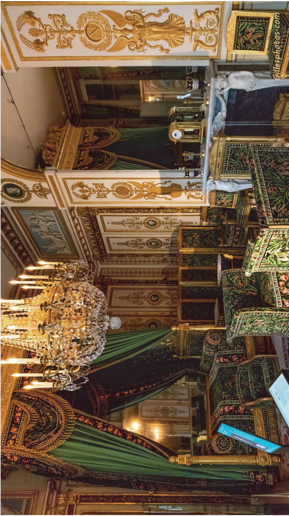
Chambre de l'empereur au château de Fontainebleau Architectes PERCIER et FONTAINE, 1808 Velours d'après Camille PERNON, 1802