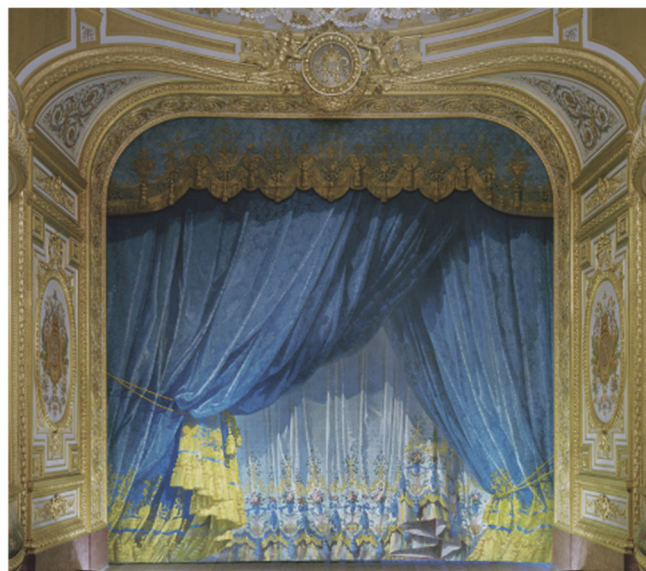
Théâtre impérial du château de Fontainebleau détail d'un rideau de scène Architecte Hector LEFUEL, 1857