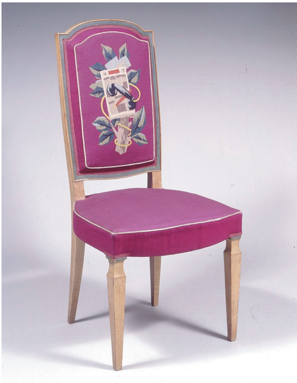
Chaise « La Presse » Pour la salle de la commission de la direction des Arts et des Lettres D'après Georges GOETZ, 1947 Atelier Pinton, Aubusson 1.05 x 0.48 x 0.46 m Mobilier national