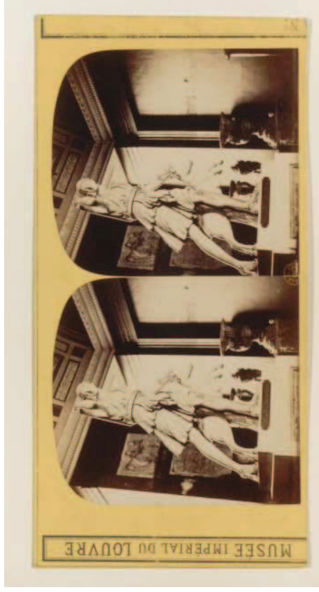
Vues stéréoscopiques, fin XIXe