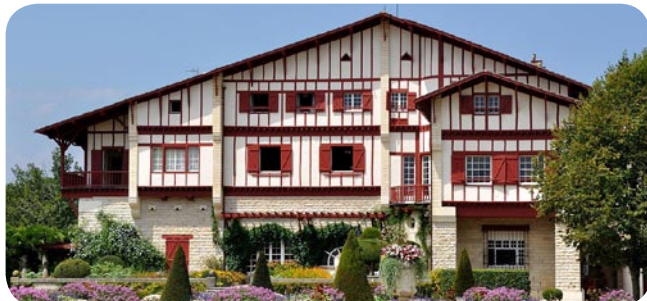
Villa Arnaga d'E. Rostand

UDAP des Pyrénées-Atlantiques à Bayonne 4 allées Marines, 64100 BAYONNE