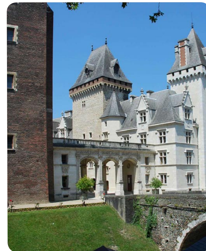
Château de Pau