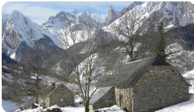
Lescun, abords et village sous la neige

Si la langue régionale reste un marqueur distinctif, les deux aires géographiques présentent des similitudes sociologiques qui se concrétisent dans le rapport à la maison (etxe ou etche en basque, case ou ostau en béarnais) traditionnellement transmise à l'aîné de la