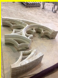
Atelier de la SGRP, Lectoure