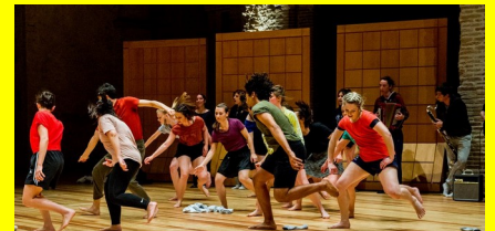
Émois dévoilés. Saint-Pierre-des-Cuisines, Toulouse.

Les étudiantes et étudiants de première année du diplôme d'État de professeur de danse à l'Institut supérieur des arts de Toulouse improviseront dans la cour d'honneur durant 1 h.