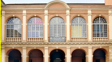
Façade, cour intérieure, hôtel Saint-Jean