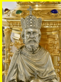
Reliquaire de la Sainte coiffe, Conques