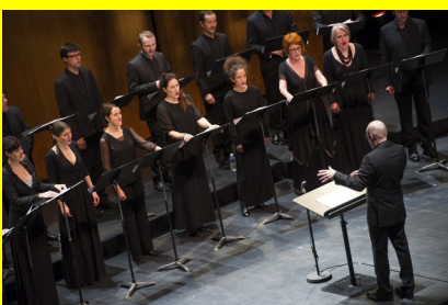
Chœur de chambre Les Éléments