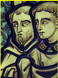
Vitrail de la basilique Saint-Sernin, Toulouse