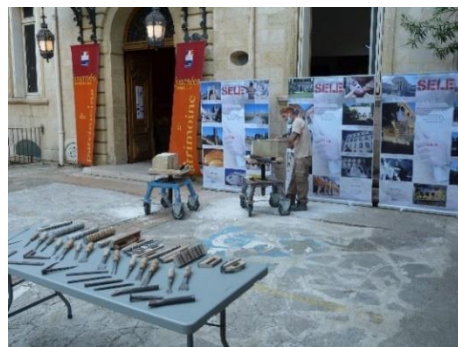
JEP 201 atelier à la Drac entreprise Sèle

Ateliers participatifs et de démonstration par le Groupement des Monuments Historiques : taille de pierre par l'entreprise Sèle et de bois et Zinc par l'entreprise Bourgeois. Qualification et savoir-faire d'excellence.