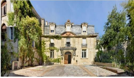
Hôtel de Grave