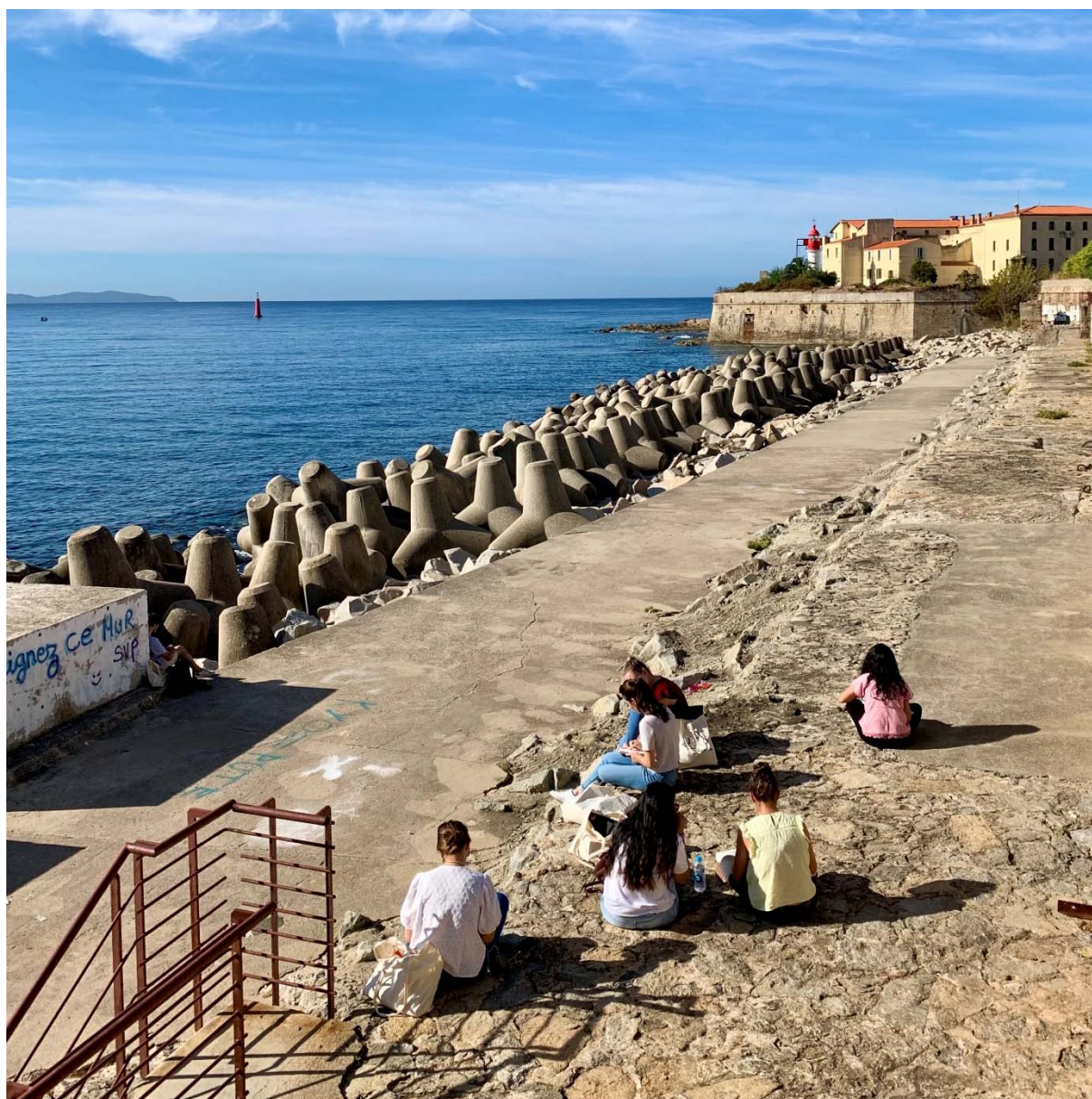
Citadelle d'Ajaccio