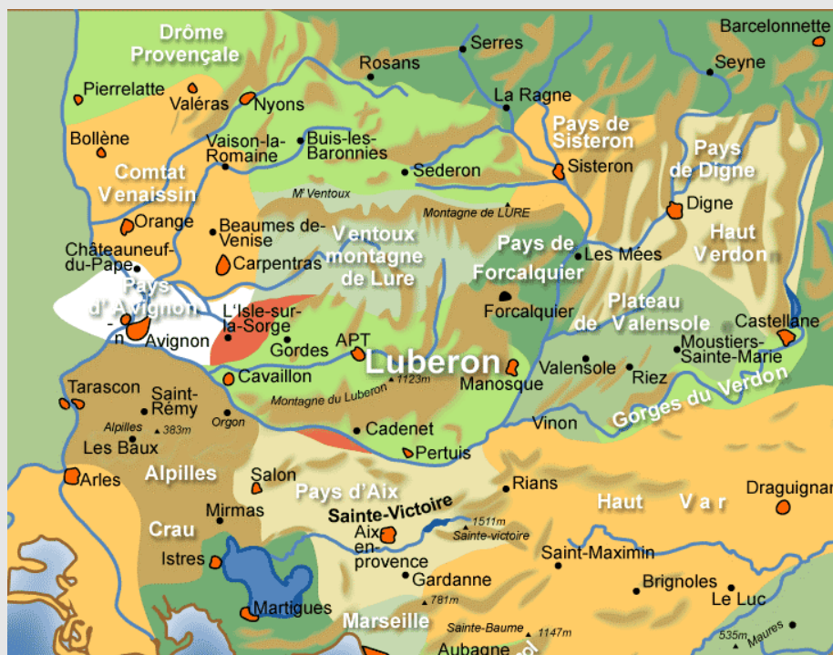
Carte de Provence.