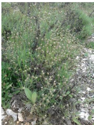
Station de plantain badasson, à Moriez, lieu-dit Aps (Alpes-de-Haute-Provence).