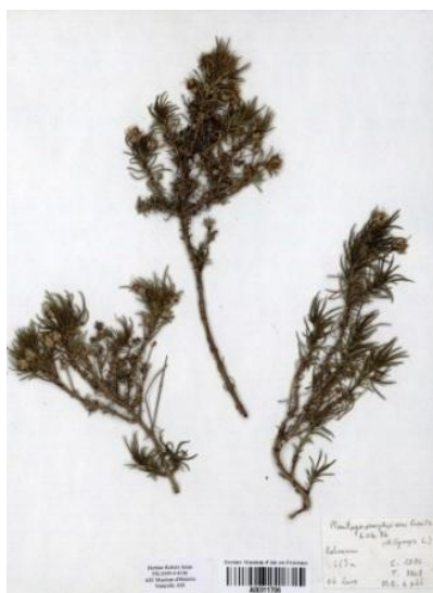
Planche d'herbier avec Plantago sempervirens Crantz (plantain badasson), récolté à Lurs (Alpes-de-Haute-Provence).