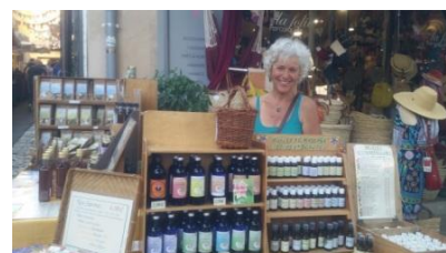
En haut : marché de Forcalquier.