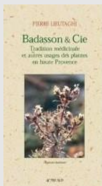
Couverture de l'ouvrage Badasson & Cie de Pierre Lieutaghi. © Actes Sud, 2009.

Pierre Lieutaghi a publié en 2009 l'ouvrage de référence Badasson & Cie [cfr. infra bibliographie].