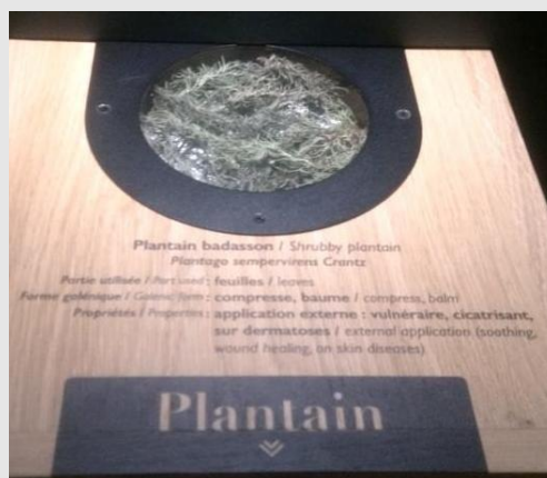
Musée de l'Herboristerie de Forcalquier : recette contemporaine d'huile de badasson et présentation du plantain badasson.

Sur son stand au marché de Forcalquier, Christine Blanc-Galléanon diffuse une notice explicative sur les emplois médicaux du badasson.