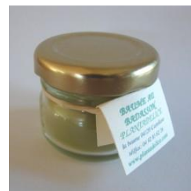
En bas : baume au badasson.