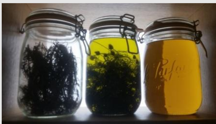
Bocaux contenant du plantain badasson et du macérat oléique de badasson, exposés au musée de l'Herboristerie de Forcalquier.

Cueillette et préparation. — Une cueilleuse-productrice décrit comme lieu de cueillette des stations en expansion, à Castellane (hameau de la Baume) et à Moriez (lieu-dit Aps).