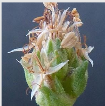
Sommité fleurie de plantain badasson.