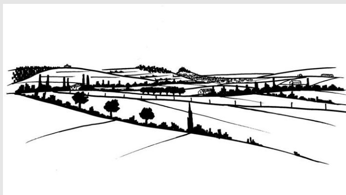
« Le pays de Forcalquier », dans Atlas des paysages des Alpes-de-Haute-Provence.

La Haute-Provence occidentale représente un territoire de plateaux et de collines, où sont présents les trois étages de la végétation méditerranéenne. Elle est circonscrite au nord par la montagne de Lure et le Ventoux et, au sud, par le massif du Luberon. Ce territoire est constitué de villages perchés et de deux bassins agricoles, où l'on retrouve les deux plus grandes villes, Forcalquier à l'est et Apt à l'ouest.