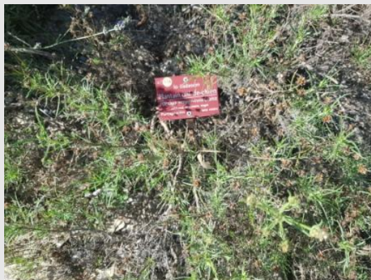
Plantain badasson dans les jardins de Salagon, jardin des simples.

On peut signaler la conservation de la plante au sein des jardins de Salagon, qui propose par ailleurs des actions de médiation (conférences, ateliers, séminaires, etc.).