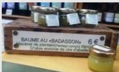
Présentation des baumes au badasson au marché de Forcalquier.