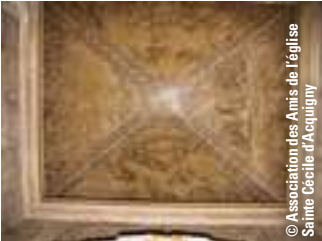
© Association des Amis de l'église Sainte Cécile d'Acquigny

02 32 50 23 14 - www.eglisedacquigny.fr Visite libre ou guidée sam 14h à 18h dim 14h à 18h30.