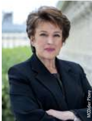
Roselyne BACHELOT Ministre de la Culture

Les déplacements de loisirs et les vacances qu'un grand nombre de nos concitoyens envisagent cette année en France pourront faire la part belle à ce patrimoine de proximité qui jalonne tout notre territoire. Pour vivre, les