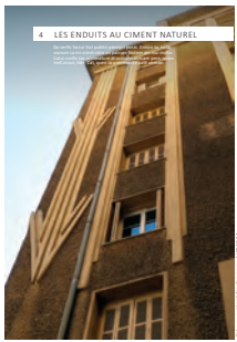
04 les enduits au ciment naturel