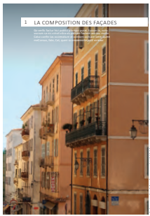
01 la composition des façades