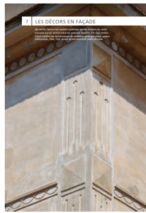
07 les décors en façade

Chaque intervention sur les façades de nos centres anciens et urbains compte et participe à l'harmonie du paysage urbain. Au cœur de nos villes et villages, l'intérêt particulier et l'intérêt général doivent être conjugués pour créer le cadre de vie que nous y recherchons tous.