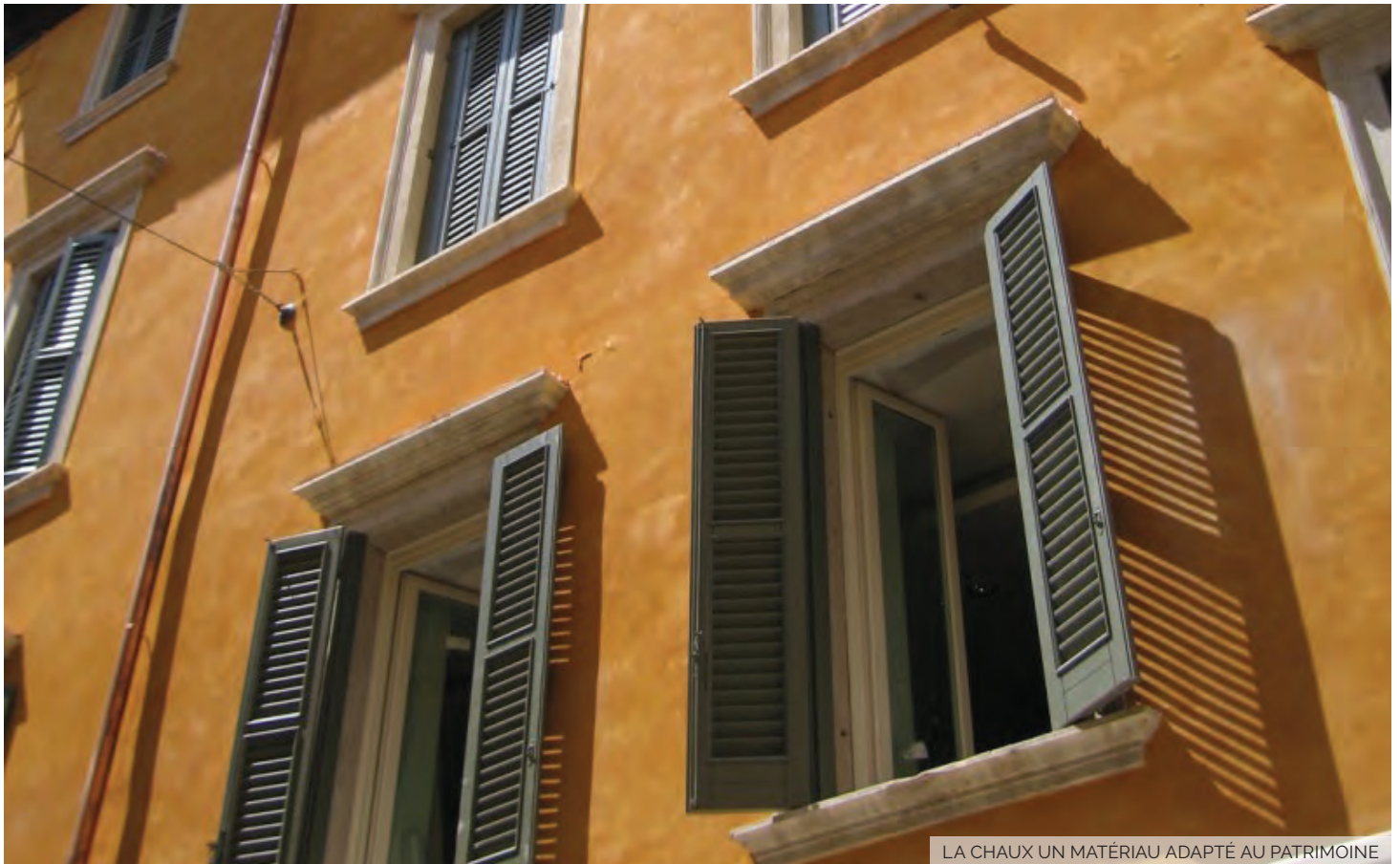
LA CHAUX UN MATÉRIAU ADAPTÉ AU PATRIMOINE