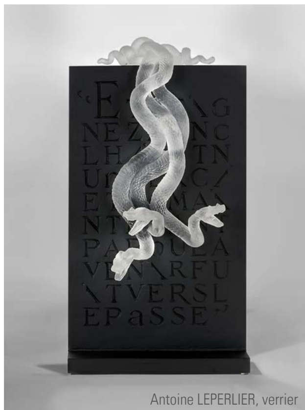
Antoine LEPELIER, verrier

Cette collection d'art contemporain a pour objectif d'avoir une dimension culturelle et pédagogique avec pour vocation principale d'assurer la promotion de la sculpture en verre par une politique de prêt à des expositions temporaires.