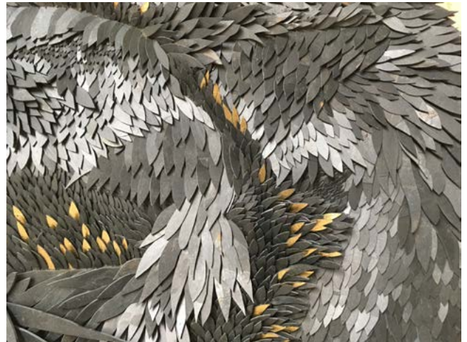
Paulina OKUROWSKA, mosaïste

Les professionnels des métiers d'art couvrent un vaste domaine d'intervention parfois insoupçonné : architecture, art contemporain, arts du spectacle (décors, costumes), décoration (tapissiers, peintres en décor, fabricants de luminaires et de mobilier), design, espace public (mobilier urbain, aménagement), industrie (prototypes complexes, moules pour la production, nouveaux motifs), luxe, mode (plume, dentelle, broderie, ennoblissement textile, modélisme), musées (entretien et restauration des collections), patrimoine bâti (restauration du patrimoine, création). Avec leurs contraintes et leurs attentes bien spécifiques, chacun de ces domaines d'activité a besoin du savoir-faire d'ateliers très qualifiés.