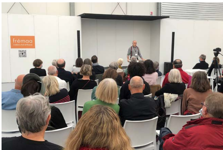
Conférence salon résonance[s] 2021

Pour compléter cette programmation, une série de projections quotidienne dévoile l'univers secret des métiers d'art et l'excellence du geste, entre tradition et innovation.