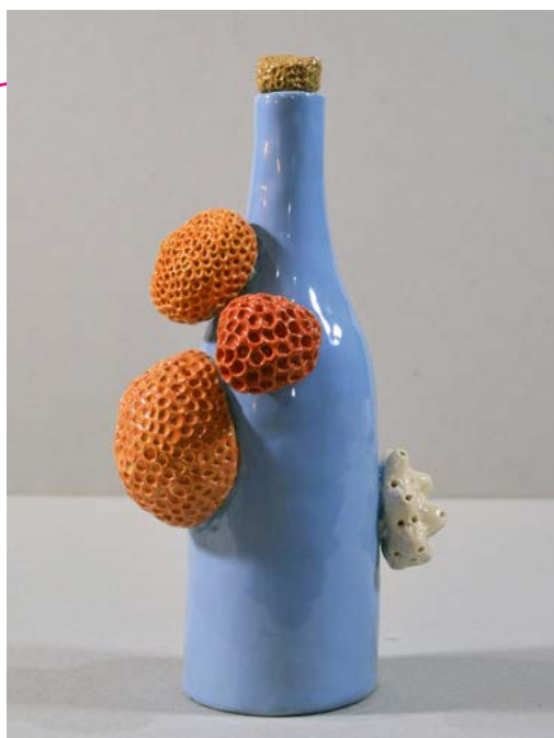
Le Palais du Corbeau, céramistes

Pour la 3 e édition consécutive, résonance[s] propose une exposition collective inédite, BOTTLE.COLLECT[S]. Elle rassemblera 30 créateurs qui ont tous accepté de relever un défi créatif : revisiter et sublimer un objet qui, à l'instar des métiers d'art, s'inscrit pleinement dans une démarche écologique et respectueuse de l'environnement, le flacon .