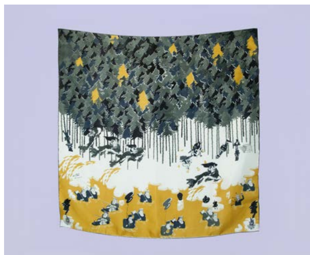
Prélude dans la Pampa, sérigraphie textile ©Alicia Gardes