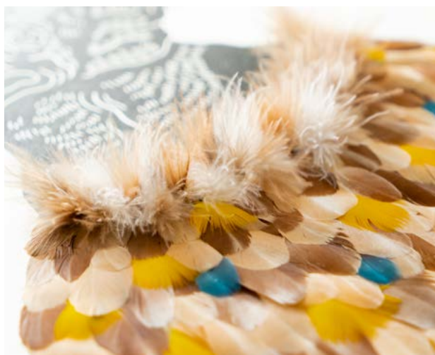
Torkil, graveur et Lucia FIORE, plumassière ©WEI Xing

Sources : ** Site Ateliers d'art de France