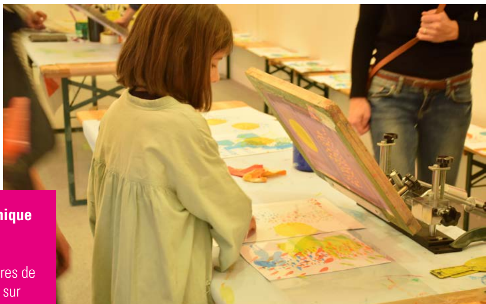
Atelier enfants salon résonance[s]

Informations au 06 76 09 42 40 Tarif : 10 € / atelier (matériel fourni) Durée : 1h30