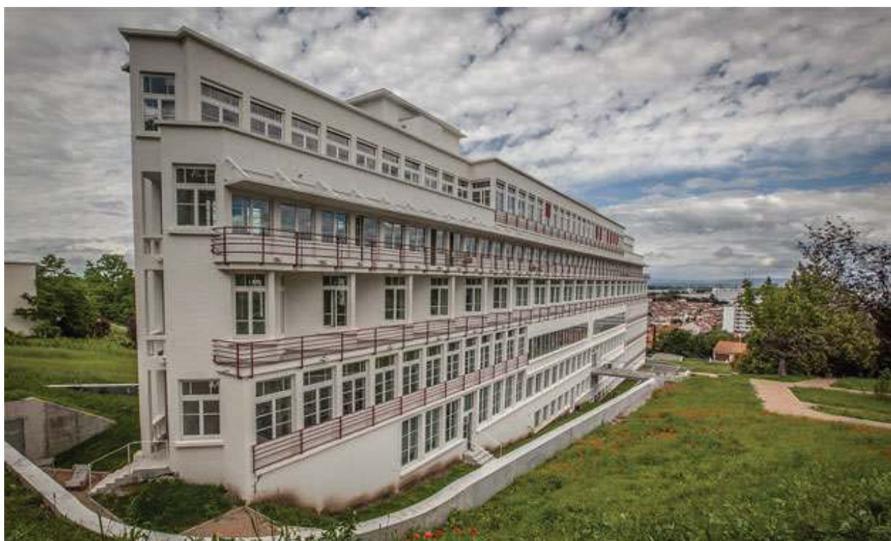
L'ENSACF, ouverte sur le monde et le paysage clermontois.

Membre fondateur des Grands Ateliers de l'Isle d'Abeau, l'ENSACF développe plusieurs modules pédagogiques en licence aussi bien qu'en master s'inscrivant dans une dynamique constructive de découverte et d'expérimentation des matériaux et des systèmes structuraux à l'échelle 1. La dimension constructive demeure fondamentale dans la culture de l'architecte et le cadre interdisciplinaire des Grands Ateliers, lieu de rencontre, d'échange et de partage des expériences liées à l'édifice est à cet égard le lieu privilégié des formations de l'ENSACF.